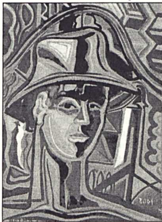
Kozma István: Önarckép

Pályafutása modellezi a kisebbségi létből kitömi akaró, feltörekvő tehetség akadályokkal terhes sorsát. A „hozott anyag” mellé társult jó testi-lelki tulajdonságok, meg néha egy kis szerencse azonban segítette haladásában.