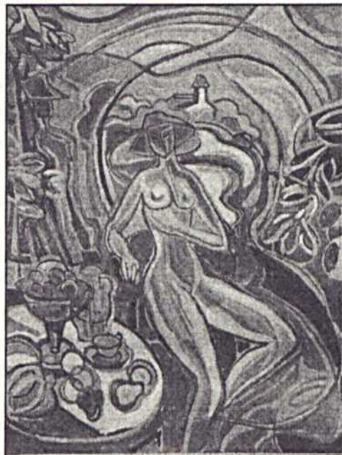
Kozma István: Nagybányai emlék

A mérleg megvonása nem egy „bemutató” írás feladata. Azt mégis leszögezhetjük – különösebb kockázat nélkül –, hogy festészete olyan kortársi jelenség, amely összekapcsolja a nagybányai hagyományokat – száz esztendő időködén át – az ezredforduló művészetével. Nemcsak „letéteményes”, hanem „továbbvivő”. Művészetében a hajdani alapítók, őrzők és újítók szelleme és vívmányai inkarnálódnak. Egyénisítő erejéből fakad, hogy a modern festészet jellegzetes közép-európai változatát teremtette meg, amely a tradíciókra épül, de olykor merészebbnek hat a nyugati rokontörékvéseknél.