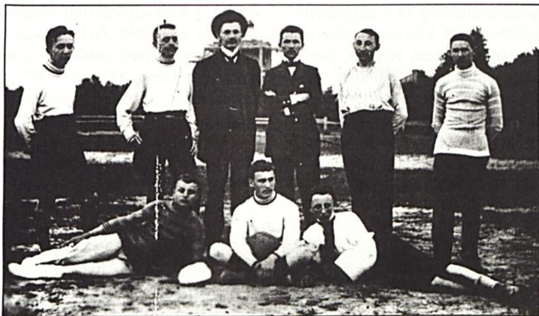
A Krúdy testvérek futtbalsapata 1906–08 között, Losonc

Jól traktált, nosztalgiát tápláló, örömteli felismeréseket kínáló Kárpát-medencei képeskönyvet forgathatunk. Banner Zoltán szakmailag korrekt, érzelmileg azonosuló, szépirodalmi ihletettséggű írását tematikailag, topográfiaailag illeszkedő rajzok tagolják, még szemléletesebbé avatva gondolatmenetét. A rajzok (s színes reprodukciók) között újdonságként fedeztük fel a hazai, tollvégre kapott budapesti, soproni, győri, szentendrei, békéscsabai részleteket. Apja szülőhelye előtt egy mezőkövesdi szobabelsővel tiszteleg. Az olvasó meg főhajtással a könyv szerzői, támogatói, a kivitelező Dürer Nyomda s a kiadás gondját vállaló nagyváradi Mobil Klub előtt. Ismételt lapozásra érdemes altummal ajándékoztak meg bennünket.