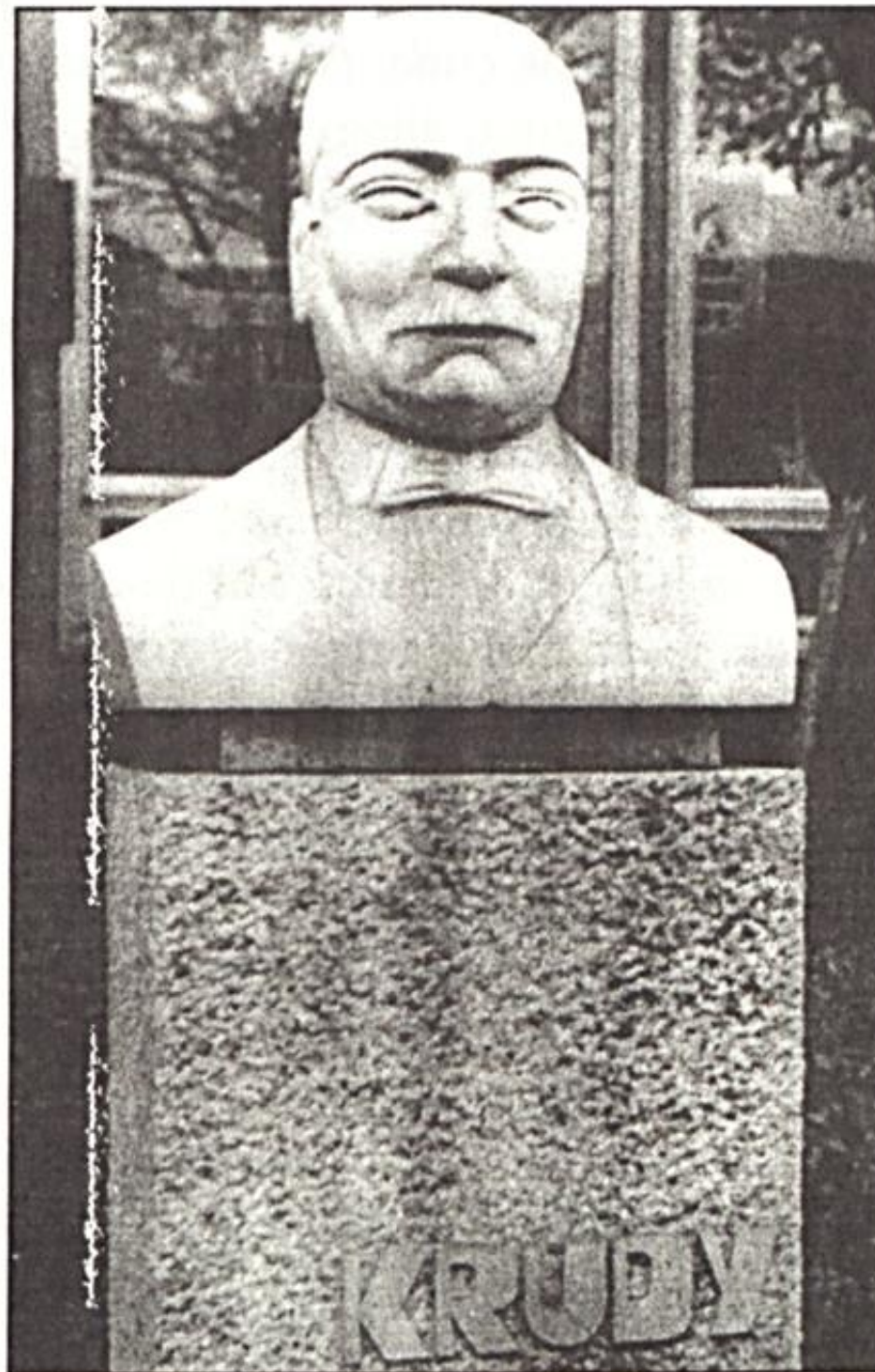
Krúdy Gyula szobra Szécsényben (Boda Gábor, 1968)