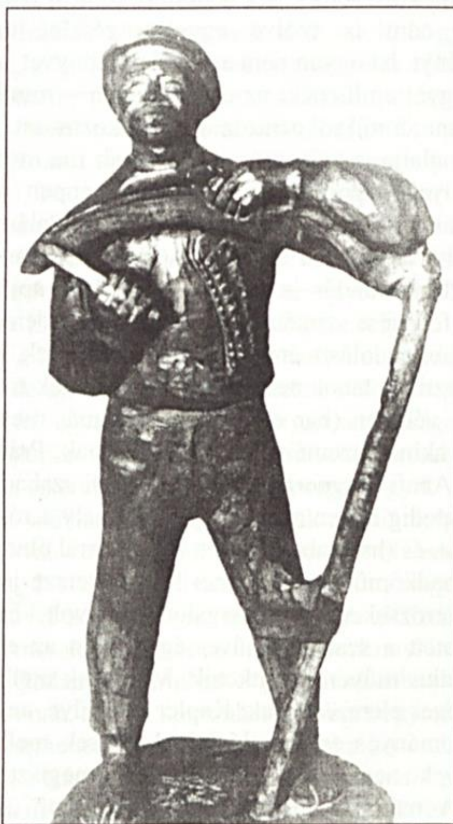
id. Szabó István: Kaszafenő

A „Megy-é előbbre majdan fajzatom...” kérdésre persze nem kapunk választ Máté Zsuzsanna kitűnő könyvéből sem (valljuk meg: nem is tanácsos ilyen kérdésre válaszolni), de azt azért megállapíthatjuk, hogy a Madách-kutatás határozottan előbbre ment, nemcsak az elmúlt száznegyven év során, de most is, ezzel a könyvvel is. Ha jobban belegondolunk, ez nem kevés, olyannyira nem, hogy valójában megkérdőjelezi az iménti vélekedést. Hiszen, ha a Madách-kutatásban előbbre tartunk, akkor – legalább ennyiben – „fajzatlunk” is előbbre ment.