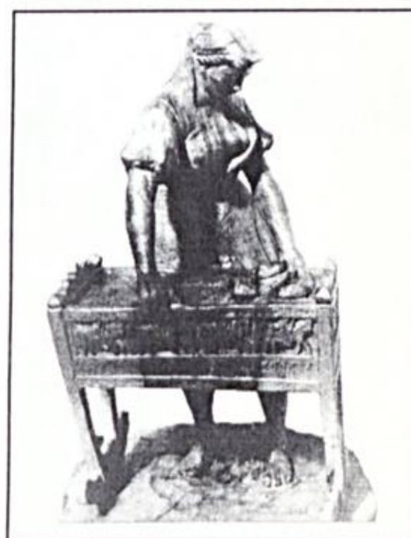
id. Szabó István szobrai