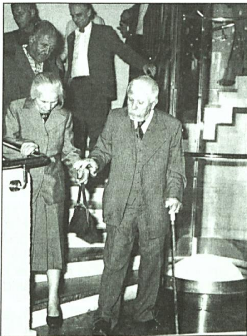
Egy kiállítása megnyitása után feleségével