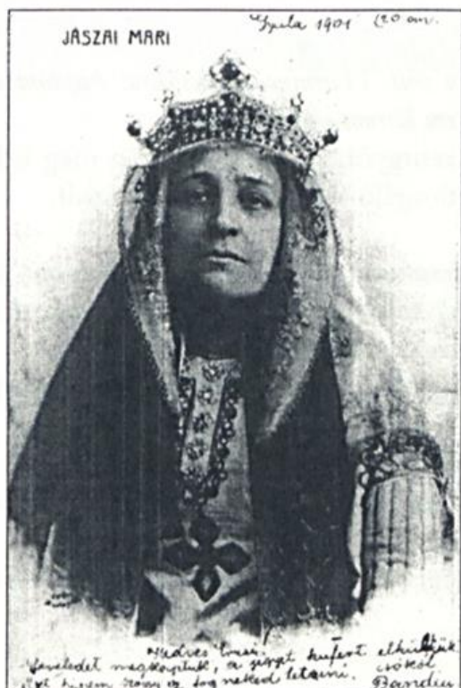
Jászai Mari Gertrudis szerepében – korabeli képeslap

Jászait – aki Elektrájával magyar színésznő által el nem ért magaslatokra emelkedett – 1906-ban baleset érte a színpadon. Amikor Gertrudisként holtan esett össze a negyedik felvonásban, eltört a jobb csuklója. Naplójában is megörökítette az esetet: „Ma egy hete eltörte a jobb karomat az a vad szamár, aki már éveekkel ezelőtt, ugyancsak a Bánk bánban, mint halott királynénak, rálépett a kezemre. Most pedig hanyatt dőfött, mint mondja, azért, mert azt hitte, hogy én nem vettem észre, hogy már megölt.