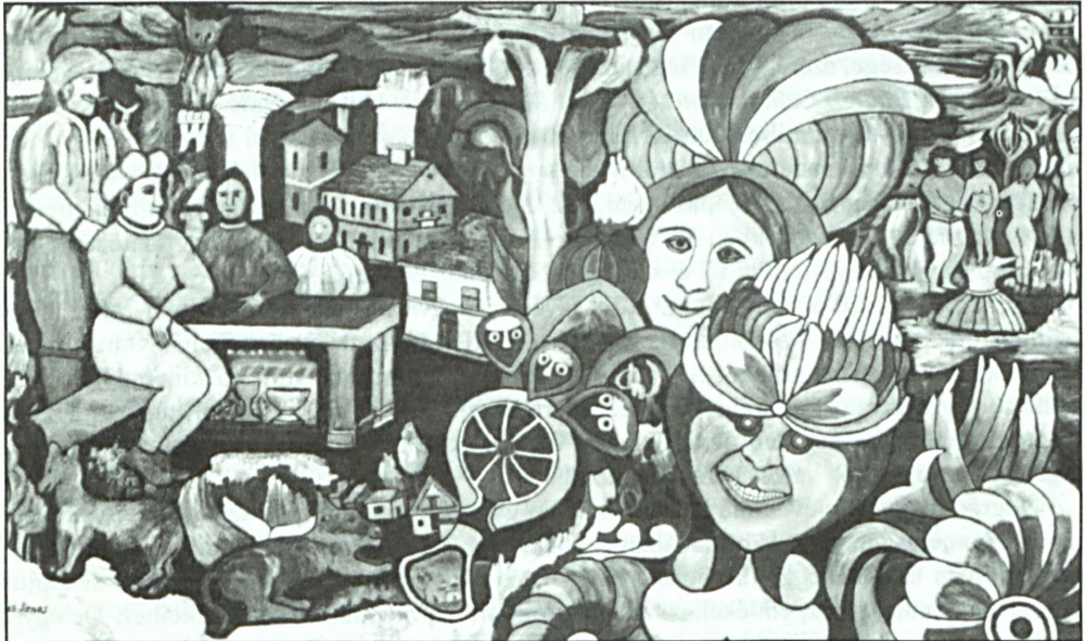
Balázs János festménye