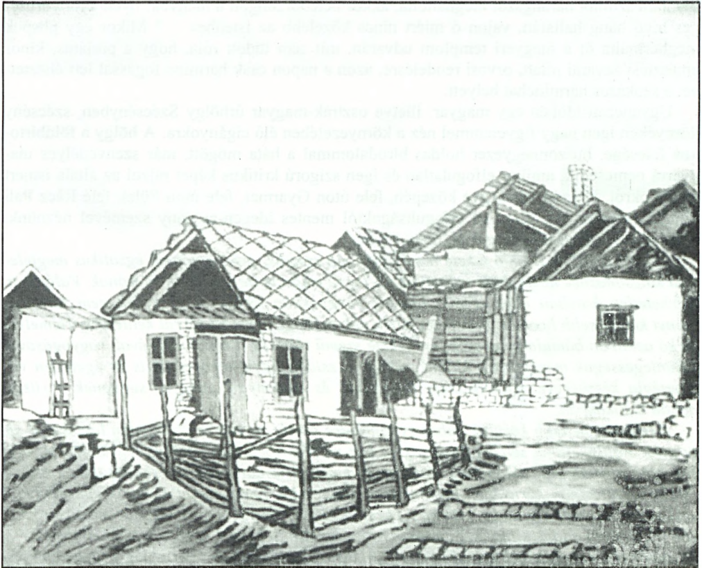
Balázs János festménye a salgótarjáni cigánytelepről