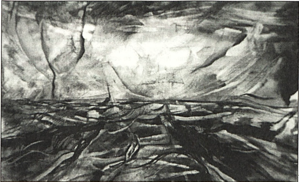
Orosz István akvarellje

– Valószínűleg. Amikor én maximálisan jó értékeléssel vagyok egy emberről és ő azt kétkedve fogadja... hát az ilyen szituáció engem mindig mellbe ütött. Tudom, a jó kritikát is mindig óvatosan kell fogadni, de ha valaki nem hiszi el, hogy te őszintén beszélsz és azt is elmondanád, ha mondjuk egy műben itt-ott nem tetszene valami, akkor az valóban csalódást okoz nekem. A másik ilyen helyzet ehhez hasonló, de visszafelé működik. Tehát, amikor az embert szembe dicsérik és utána a háta mögött – általában valamilyen pozíció érdekében – a munkásságát, vagy az emberi mivoltját kissé ferdén „mutatják be”. Ez nyilvánvalóan egyrészt fáj, másrészt viszont én az a típus vagyok, akinek egy ilyen helyzet még az önbizalmát is meg tudja ingatni. Ilyeneket hallva egészen meg tudok rendülni, talán tényleg túlságosan érzékeny ember vagyok az ilyen helyzetekre. Ezzel csak azt akarom mondani, hogy ilyen is volt már... Nem vettem azonban az ilyen történeteket mindig a szívemre, mert úgy érzem – te is tapasztaltad –, hogy bármerre járok, az embert tisztelik, szeretik. Ez pedig nekem sokkal fontosabb. Számomra az emberek a legfontosabbak! Az emberekre oda kell figyelni, törődni kell velük, mint ahogyan mi is elvárjuk ezt mindenkitől és egymástól.