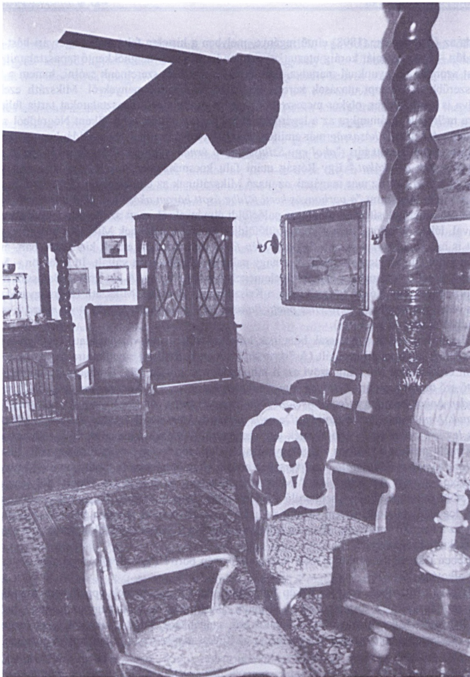
Hór: a felújításra váró emlékhely