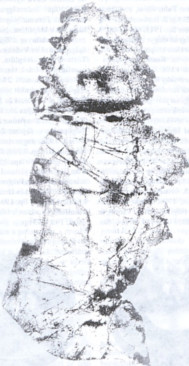
Kéri Imre munkája