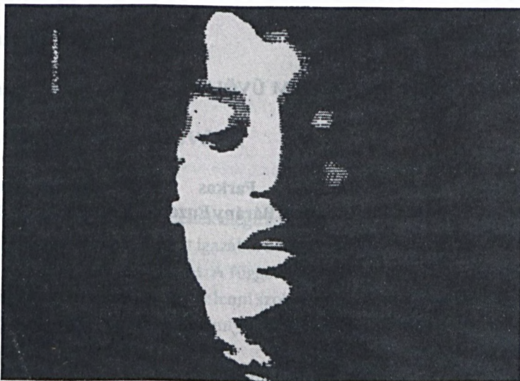
Kovács B. Sándor : Fotógrafia