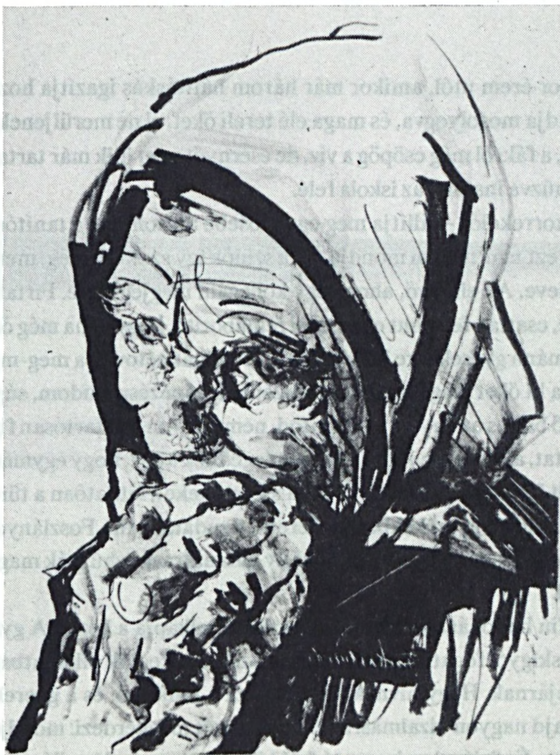
Farkas András: Tűnődő (vegyes technika)

Herceg, nem a könyv vagy a tűz, A pirula, mely minden bajt elűz: Ez az állat a nagy találmány S elviszi a balhét a fekete bárány.