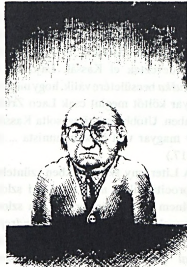
Olexa József: Grafika

Olvassák el figyelmesen a felhívás aláírói az ő szövegük alatt Laco Zrubec négy hasábját. Az utolsóban a Gregor Papuček magyarországi szlovák költővel készített riportjának