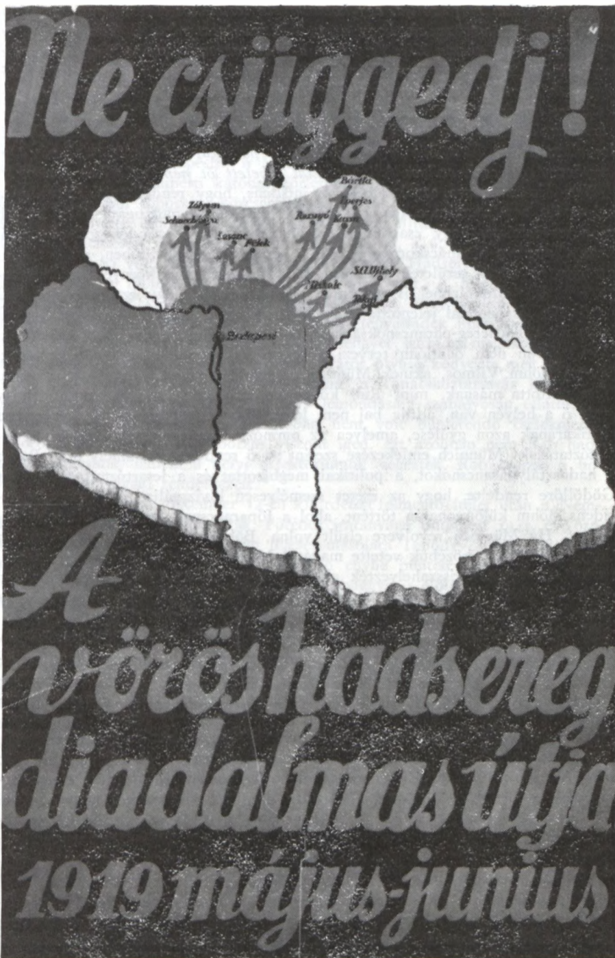
Magyarország a vöröshadsereg diadalmas útjának térképén, 1919. május-június. A térkép a vöröshadsereg mozgását mutatja a nyugati és déli területekről a keleti és északi irányok felé.