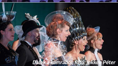
Dalok a kamrából

Tavaly két előadás is a Városmajori Szabadtéri Színpadon készült, idén a Dalok a kamrából és az Ahogy teccik mellett látható Göttinger Pál írta-rendezte darab ( Az Öreghid alatt ), Grecsó-regény ( Vera ), szívmeg klasszikus ( Dunya-kanyar ), fikciót és valóságot egymásba mosó életrajzi mű ( Karády zárkája ), két Shakespeare-dráma egymásra és egymásba játszatra ( Hamlet , a dán királyfiból lett brit király ) és egy minden érzéket igénybe vevő összművészeti produkció (színesztézia).