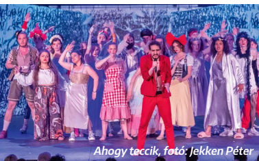
Ahogy teccik, fotó: Jekken Péter