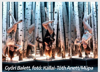
Győri Balett, fotó: Kállai-Tóth Anett/Müpa