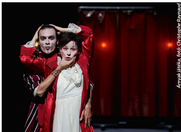
Árnyak játéka

📍 Nemzeti Színház 📅 ÁPRILIS 20. – MÁJUS 8. 🌐 mitem.hu