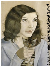
Lucian Freud: Lány macskával (1947)

A festészetet sokan sokszor, többféle korszakban temették már. De egyrészt a festészet mindig sikeres a gyűjtésben, a műkereskedelemben is, másrészt pedig mindig feltámad, és újra kitalálja önmagát. Az MNG tárlata részben Londonból, a TATE-ből érkezik és a figurális festészet egy igen markáns vonulatára koncentrál. A Londoni Iskolának nevezett irányzat alkotóira, mint amilyen Francis Bacon, Lucian Freud, Frank Auerbach és Leon Kossoff, de művészetük előzményeire és a következményeire is kitékintést kínál, a 20. század második felének részben brit, részben nemzetközi művészetében. Magas színvonalú festészet ez, és akit az érdekel, hogy mitől lesz egy festő szupersztár, nemzetközi név, ezen a kiállításon azt is megsejtheti.