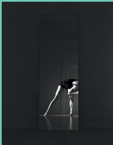
Salla Tykkä: Torzo I., 2015