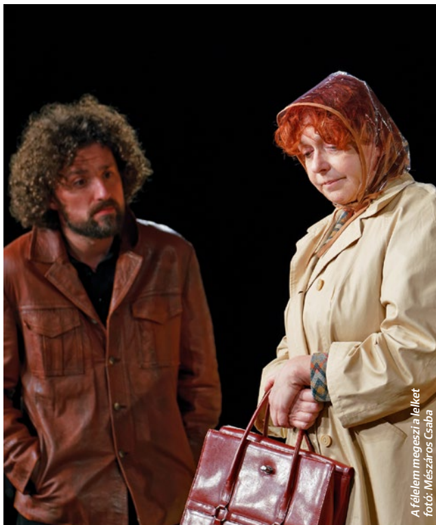
A félelem megézi a lelket

Egypercestől nagyregényig bármi filmre kerülhet, és színpadra is, így ma már nem csodálkozunk dráma megfilmesítésén, forgatókönyv színrevitelén, de azon sem, ha filmet használnak egy színházi előadásban. Az biztos, hogy a vaudeville és a melodráma erősen hatott az első filmekre, de ami utána következett, nos, attól kezdve tulajdonképp visszafejthetetlen, mi volt a műfaji hatások iránya. Azt például tudták, hogy a Ruben Brandt , a gyűjtő című animációs film erősen a mozgásra, koreográfiára építő múzeum-színházi előadásként indult?