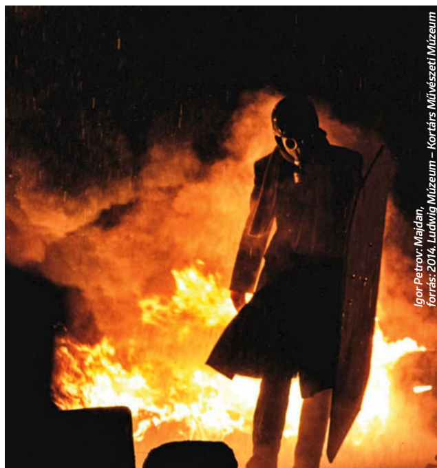
Igor Petrov: Májdan, forrás: 2014, Ludwig Múzeum – Kortárs Művészeti Múzeum

📍 UVG Art 📅 JÚNIUS 10-ig h–p.: 10.00–19.00, szo.: 11.00–18.00, v.: 12.00–17.00 💎 INGYENES 🌐 www.uralvisiongallery.com