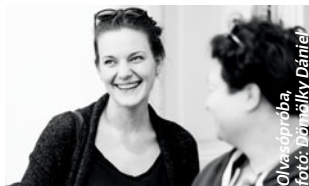
Olvasópróba