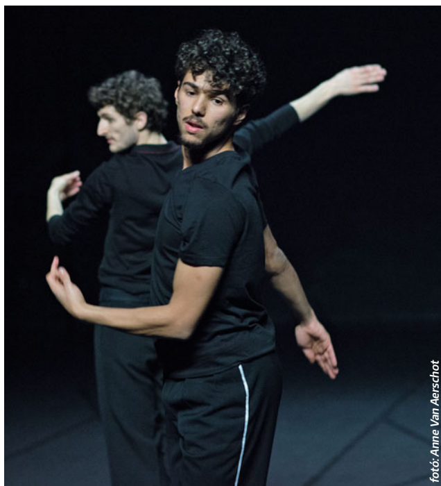
fotó: Anne Van Aerschot