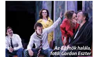
Az ügynök halála

Nézőként milyen számodra egy inspiráló előadás? Ami felébreszt. Ha meg tudja ingatni a hiedelemrendszeremet. Ha kétségbe ejt az, amit állít, és rákényszerít, hogy felülbíráljak és újratevesszek. Ha nem csak intel-