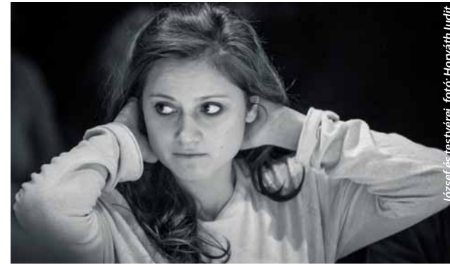
József és testvérei