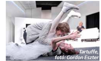
Tartuffe, fotó: Gordon Eszter