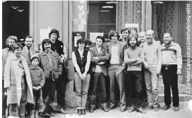
A Bertalan Lajos utcai üzlethelyiség előtt

Ma nehéz elképzelni... helyesbítünk: ma megint nem nehéz elképzelni, hogy egy lap túl sok vizet zavar, ezért bedarálják. A Mozgóval ez történt. Múltfeltáró tárlat Szentendrén.