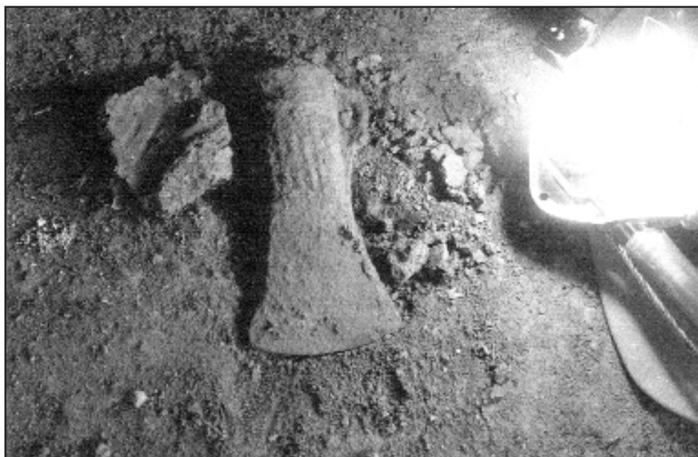
2. ábra A bronzbalt előkerülési helyén