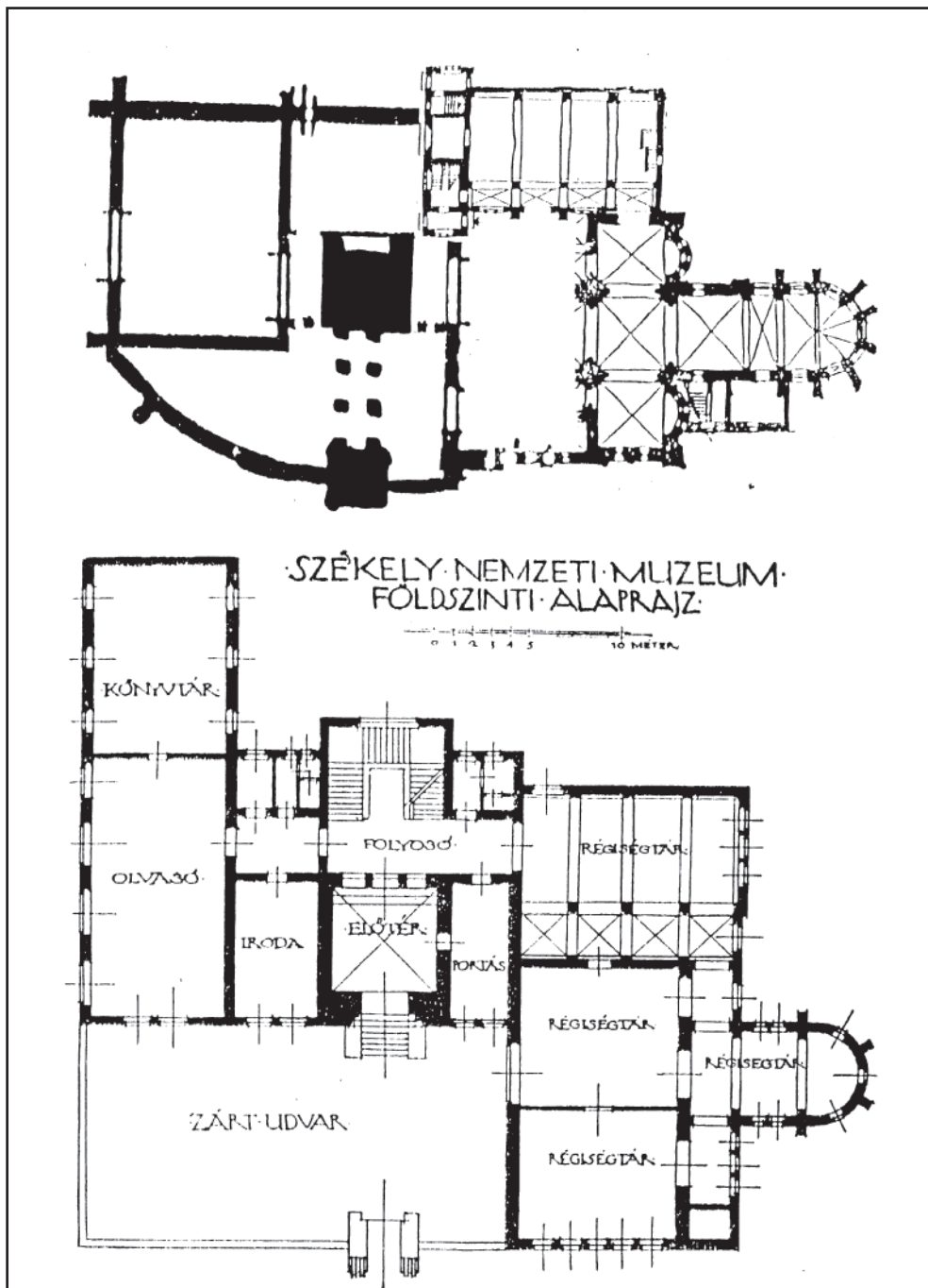
1. ábra A Székely Nemzeti Múzeum alaprajza. KÓS Károly kezdeti „naturalista elgondolásában” (Anthony GALL gyűjtése) illetve megvalósult, letisztult változatában (közölve az 1929. évi Emlékkönyvben) .(K.A.)