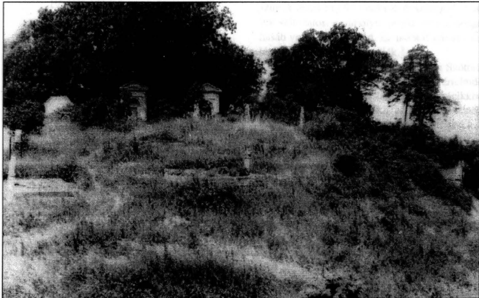
2. ábra A kicsi római katolikus temető