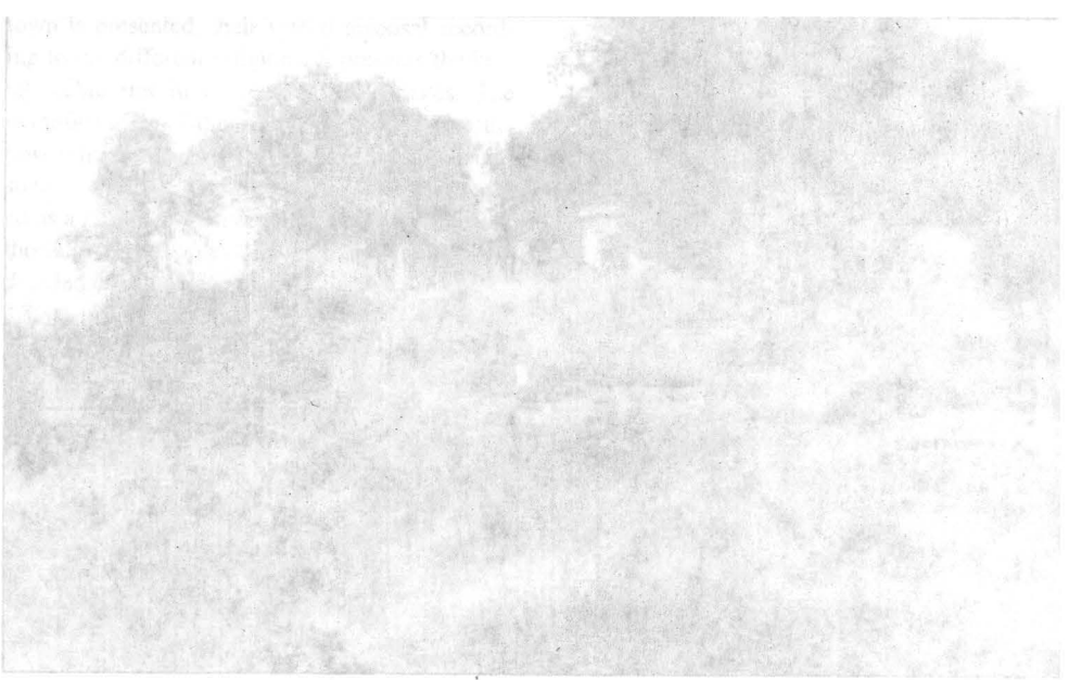
Ötvenháromféle talajszelvény a református temetőben