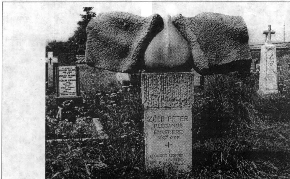
4. ábra FERENCZ Ernő: ZÖLD Péter emlékműve. Csíkrákosi temolomkert. (A felvételeket NAGY Gyöngyvér készítette.).