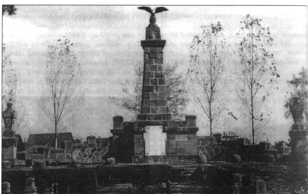
3. ábra A madéfalvi veszedelem (Siculicidium) emlékműve. Madéfalva. Magassága 13,20 m. 1899-1905