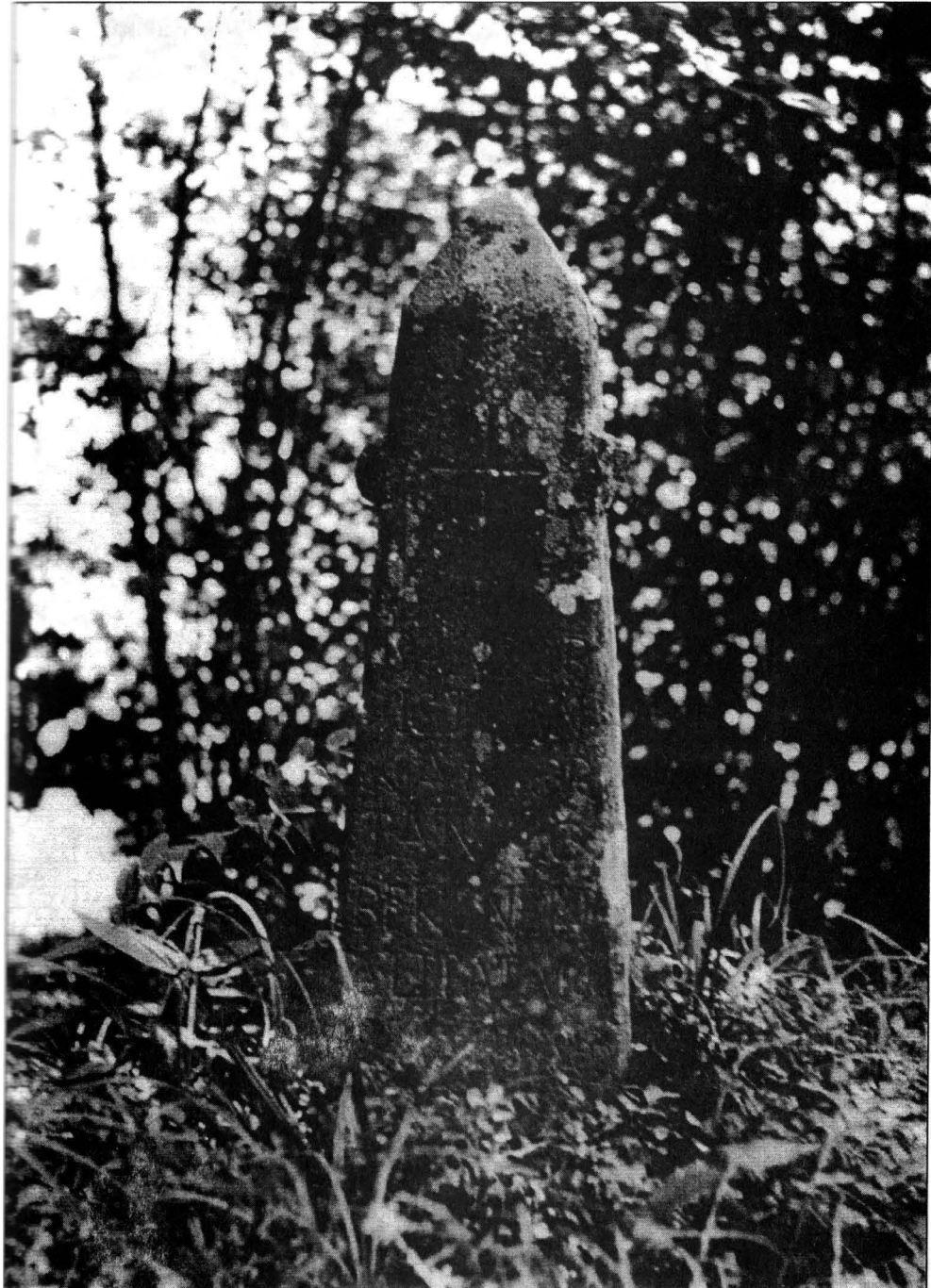
2. ábra SÁNDOR István kántortanító sírja a bodvaji temetőben