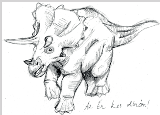
5. ábra. Sokféleség tisztelete, negyedik szint – Tanulók által készített illusztrációk a földtörténeti meséhez a „Mesés kalandozás Amerikában” c. feladathoz

Az életben a szervezőképesség mind a mindennapokban, mind az iskolában, a munkában nélkülözhetetlen képesség, így kiemelten fontos a fejlesztése. Minél fejlettebb