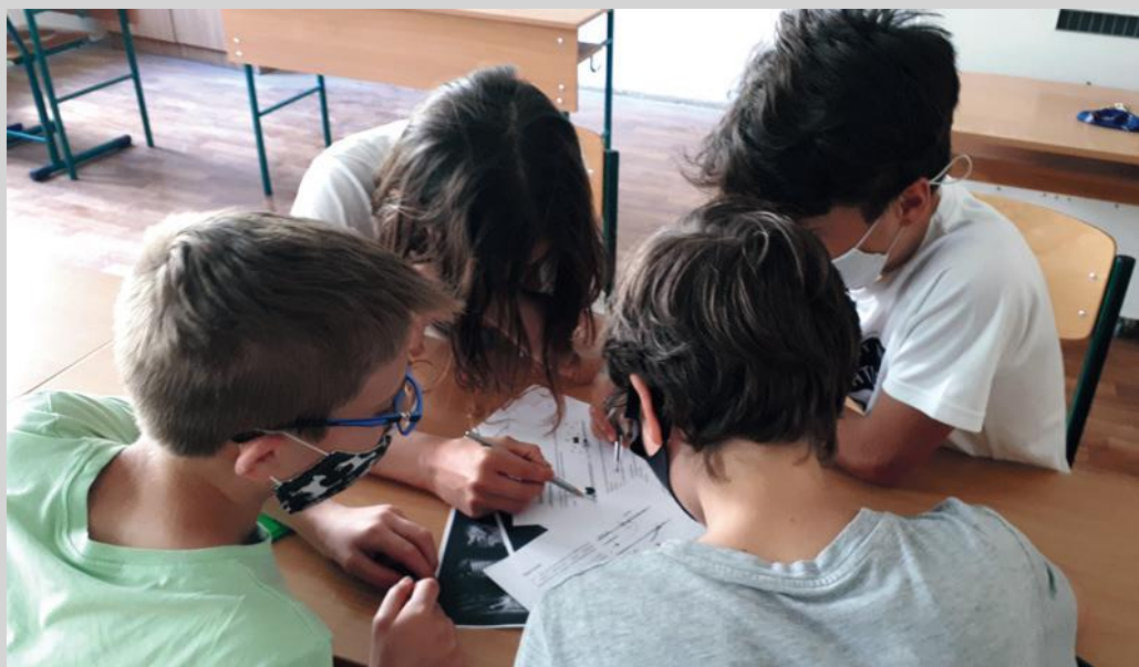
4. ábra. Sokféleség tisztelete, első szint – Az „Üdv nálunk!” c. feladat megoldása csoportos megbeszéléssel

úgy, hogy az a számára minél kedvezőbb legyen. A jó szervezőképességgel bíró egyén képes a teljesítendő feladatok között elsőbbségi sorrendet állítani a feladatok nehézsége, időigénye és fontossága alapján. Ez a képesség vonatkozik továbbá az emberek koordinálására is, azaz az egyén képes meglátni a társai erősségeit, gyengeségeit és ezek alapján megítélni a feladatok megoldására való alkalmasságát.