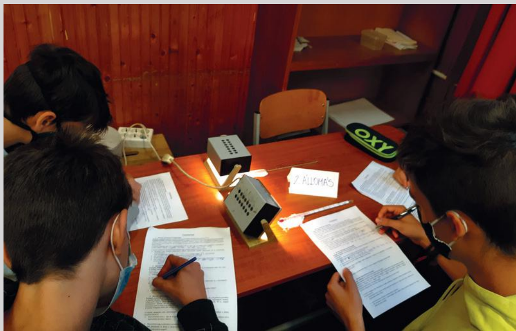
3. ábra. Társas aktivitás és együttműködés, emelt szint – „Mérsékeltén a miénk” feladat megoldása szakértői mozaikokban

Az egészséges életvitel esetén tanárként a feladatunk nem az egészséges életvitel betartatása, hanem fontosságának, szükségszerűségének megértetése a diákokkal, illetve a kivitelezéséhez szükséges körülmények megteremtése az iskolában. A testi jólét kialakításához a mindennapi testnevelésóra és egyéb programok (pl. kirándulások, sportnap) teremtik meg a szükséges feltételeket. A lelki jólét kialakításának segítése főleg a szülők feladata, de osztályfőnöki órák keretében is érdemes hangsúlyt helyezni rá (önismereti játékok, csapatépítés, személyiségtesztek, elbeszélgetések stb.) A szociális jólét, illetve az egészséges környezet kialakításához szükséges képességeket és tudást földrajzóra keretében is jól tudjuk fejleszteni. A szociális jólét kialakításához a különböző együttműködést, empátiát és toleranciát fejlesztő feladatok alkalmazásával járulhatunk hozzá, míg az egészséges környezet kialakításához kapcsolódóan minden környezetszennyezéshez kapcsolódó tananyag tanításával és az azokra épülő, azokat feldolgozó feladatokkal tudunk hozzájárulni. Az a cél, hogy a tanuló már 5. osztálytól kezdve ismerkedjen az egészséges életvitel fontosságával, illetve képes legyen felismerni mindennapjaiban azokat a lehetőségeket,