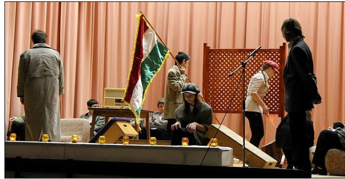
barikád és forradalmárok a színpadon