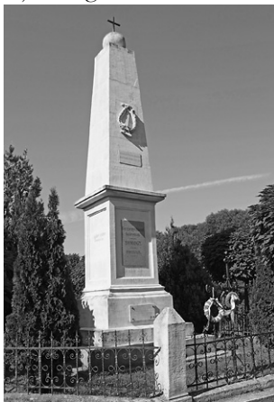
Berzsényi síremléke a niklai temetőben

Már régen nem ül ide ki senki. A mostani látogató az üres, befüvesített semmit látja. Meg azt: már csak néhány eltévedt darázs látogatja a közeli gyümölcsösből az