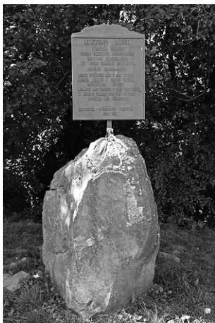
Emléktábla a Bazsi melletti Bórczeháton

Emlékeim szerint a '60-as évek végén egy fára szegezett tábla tájékoztatott lakonikus rövidséggel a látnivalóról, amit mégsem láttunk a fáktól és a felhőktől. Most már kiépített parkoló, visszavágott-megritkított növényzet vár bennünket és valami