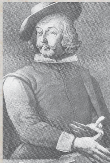
Jakob Hutter portréja