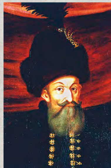
I. Rákóczi György

Svájcban, valamint a Rajna-vidéken, illetve Hollandiában. Azonban az anabaptisták ellen egyre erősödő fellépéseknek köszönhetően hamar megindult e közösségek kivándorlása elsősorban Itália felé, majd Ausztriába, Morvaországba, végül Magyarországra.