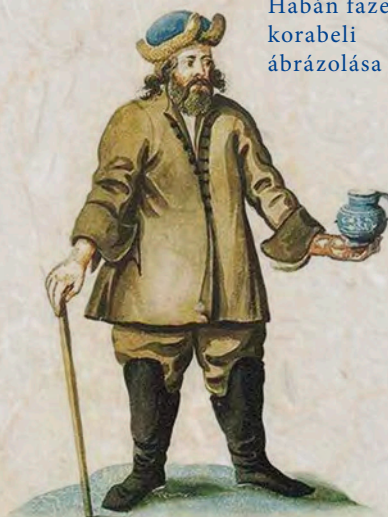
Habán fazekas korabeli ábrázolása

A 15–16. század folyamán egyre erősödő főbb protestáns vallási irányzatok mellett megjelentek a reformáció egy eltérő ágának számító anabaptista közösségek is. Az anabaptizmus mint vallási mozgalom vélhetően Zürichben alakulhatott meg, Ulrich Zwingli (1484–1531) svájci reformátor tevékenységének ellenhatásaként. [Az anabaptizmus a reformáció egyik népi irányzata, hívei úgy vélik, hogy csak felnőtt fejjel lehet dönteni a kereszténység felvétele mellett, így ragaszkodtak a felnőttek újrakereszteléséhez. A kifejezés a görög ana 'újra' és baptizmosz 'keresztelés' szavakból áll össze. – a szerk.] A közösség kezdetben lazább szervezeti formában, kis létszámban működött, hittételei tehát zárt közösségekben terjedtek el elsősorban