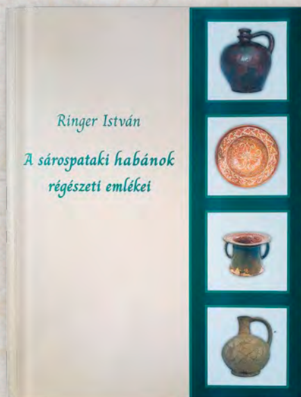
Ringer István könyvének borítója