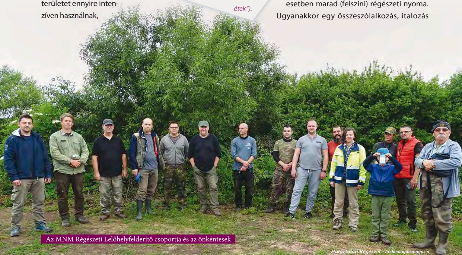
Az MNM Régészeti Lelőhelyfelderítő csoportja és az önkéntesek

akkor annak detektálható nyoma is meg lehet találni. A kutatás folyamán a csatatérkutatások során alkalmazott, elsősorban fémkeresős lelőhelydiagnosztikai eljárásokat vetettük be, hiszen elsősorban fémleletekre számítottunk, érmékre, használati tárgyra stb. Bár nyilvánvalóan sok hulladéktól helyben szabadultak meg (pl. a leölt állatok maradványai), ezeknek nem minden esetben marad (felszíni) régészeti nyoma. Ugyanakkor egy összeszólalkozás, italozás