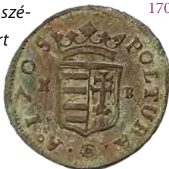
Réz szükségpénz, vagyis poltura 1705-ből