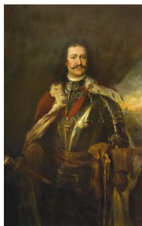
II. Rákóczi Ferenc portréja

A fejedelem Nyitra várából Bercsényi Miklós főtábornokkal és Széchenyi Pál kalocsai érsekkel indult útnak szeptember 1-én, majd 6-án érkeztek Szécsénybe. Az országgyűlést ünnepélyes keretek között nyitották meg szeptember 12-én, szombaton. A helyszínen, az úgynevezett Borjúpáston azonban már augusztus közepétől lázas munka, szervezés, építkezés zajlott, ugyanis az országgyűlés számára és a központi hivataloknak külön sátorvárost építettek fel. Szükség is volt a táborra, hiszen több ezer ember (és több száz állat) ellátásáról csakis így tudtak gondoskodni. Az országgyűlés egyik fontos momentuma volt, hogy arra minden mágnás (azaz nemes) személyre szóló meghívót kapott, vagyis nem csak követeiken keresztül vettek azon részt. Ez azt is jelentette, hogy egy-egy nemesemberrel akár egy kisebb udvartartás is érkezett: szolgálok, katonák, testőrök, személyi titkárok stb. A fejedelmi udvart szintén több tucat személy kísérte, nem beszélve a testőrökről, katonákról, a vármegyék és a szabad királyi városok képviselőiről. Ahogyan Rákóczi később írta: „Az országgyűlés számára, két hadvonal között, szállásom (a szécsényi vár) ligetén kívül, nagy sátort vonattam föl.” (II. Rákóczi Ferenc: Emlékirataim) A nagy sátor nem