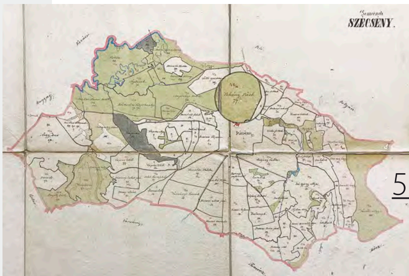
A Borjúpást (másnéven Tehénpást) Szécsény kataszteri térképén

Bár a kutatás korai fázisában vagyunk, mégis már számos, a korszakra datálható lelet került elő. A leletek szóródásának térképre vetítésével pontosabban határolhatjuk le azokat a területeket, ahol további, célzott geofizikai méréseket is tervezünk. Így talán nemcsak az egykori sáttortábor kiterjedését, de talán a híres fejedelmi sátor pontos helyét is megtalálhatjuk idővel. Egy biztos: egy lépéssel mindenképp közelebb kerültünk a „szécsényi rejtély” megoldásához.