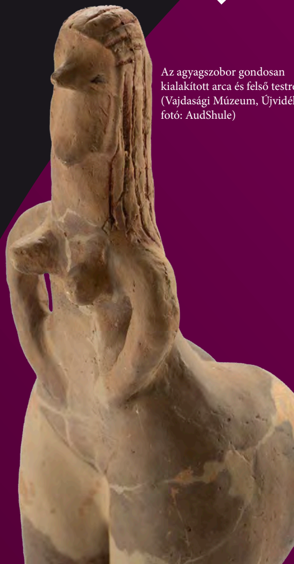
Az agyagszobor gondosan kialakított arca és felső testrésze (Vajdasági Múzeum, Újvidék)

A „vörös hajú istennőként” híressé vált tárgy voltaképpen egy újkőkori, agyagból megformázott, majd kiégetett szobrocska, szakkifejezéssel idol. A lelet 1989-ben került napvilágra a Hódság (szerbül Odžaci) melletti Donja Branjevina (Vajdaság, Szerbia) területén végzett régészeti ásatások során. Magassága 38 centiméter, ami lényegesen nagyobb a többi, hasonló típusú szoborhoz képest, ezek magassága ugyanis általában nem haladja meg a 15 centimétert. Az agyagszobor feje gondosan megformált: az arcot az áll erőteljes hangsúlyozásával emelték ki. Az arcnak a nyaktól való karakteres elválasztása – egyes vélemények szerint – akár arra is utalhat, hogy a művész valójában egy, a figura arcát fedő maszkot kívánt megjeleníteni. Az orra hosszúság, kissé kihegyesedő, míg a szemeket bekarcolt vonal jelöli, amit még az égetés előtt egy éles tárggyal alakítottak ki. Az ajkakat egyáltalán nem jelezték, helyén teljesen sima felület látható. Különös figyelmet