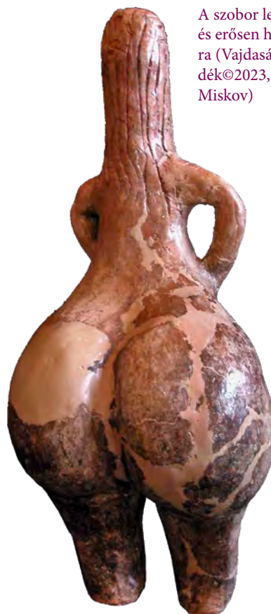
A szobor leomló hajzuhataga és erősen hangsúlyos tompora (Vajdasági Múzeum, Újvidék©2023, fotó: Aleksandar Miskov)

A szobor karjait könyökben behajlítva, az alhasra helyezve formázták meg, a kezeket és az ujjakat vékony bevágásokkal jelölték. A mellek hangsúlyosan nőiesek és erőteljesen kiugranak a mellkas síkjából. A szeméremajkat bekarcolt, fordított háromszög reprezentálja. A csípő, a combok és a farizmok rendkívül túlhangsúlyozottak, tovább nyomatékosítva az elsődleges női nemi jellegeket. A lábak kissé el is távolodnak egymástól, és ellapított részben végződnek, ám a lábfejeket nem ábrázolták. A jobb láb felső része hiányzik, ugyanis a szobor sajnos töredékes formában látott napvilágot. Előlnézetből a hangsúlyos „homokóra” testalkat erőteljes nőiességet áraszt. Egyes