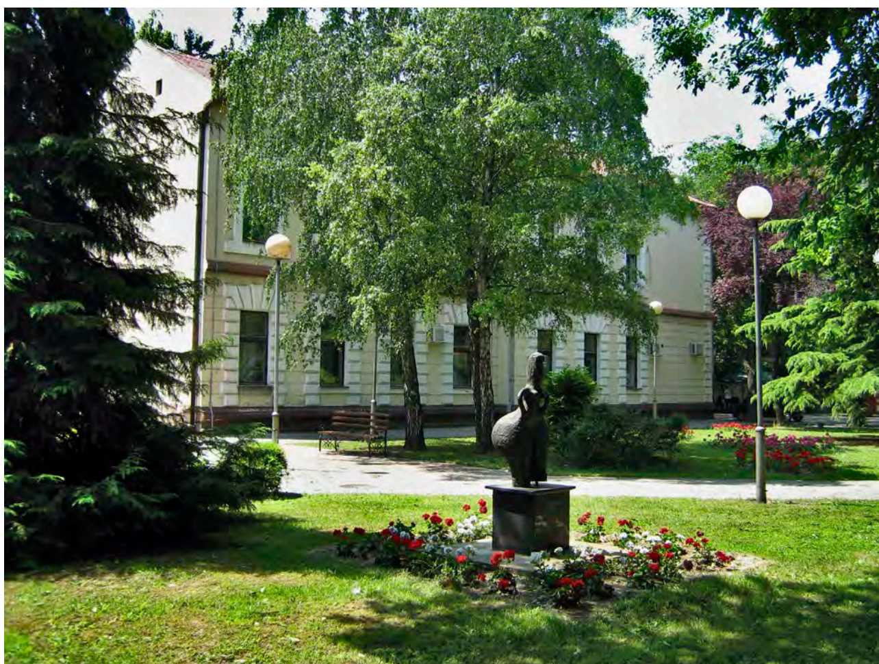
A vörös hajú istennő szobra Hódáság község központjában