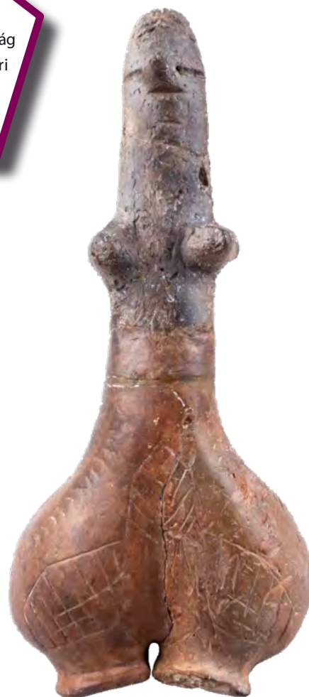
Zsírfarú női agyagszobor Endrőd-Szujókeresztről

Az ehhez hasonló szobrokat leggyakrabban a termékenységgel, a termékenységi kultuszokkal kapcsolják