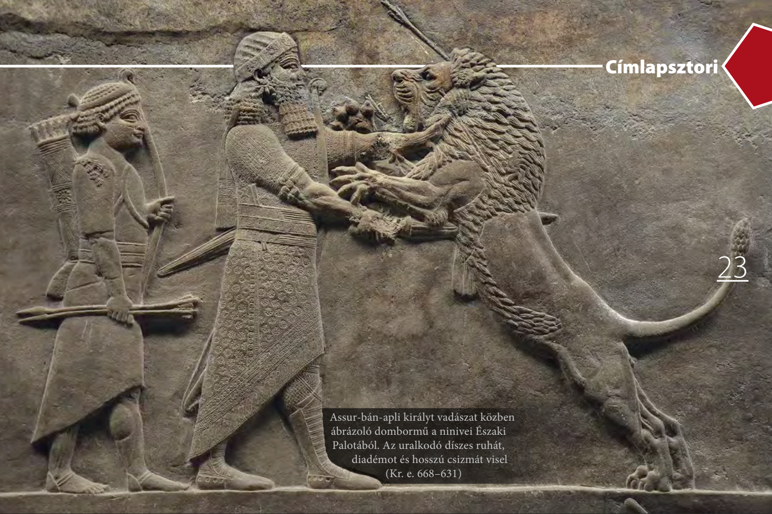
Assur-bán-apli királyt vadászat közben ábrázoló dombormű a ninivei Északi Palotából. Az uralkodó díszes ruhát, diadémot és hosszú csizmát visel (Kr. e. 668–631)