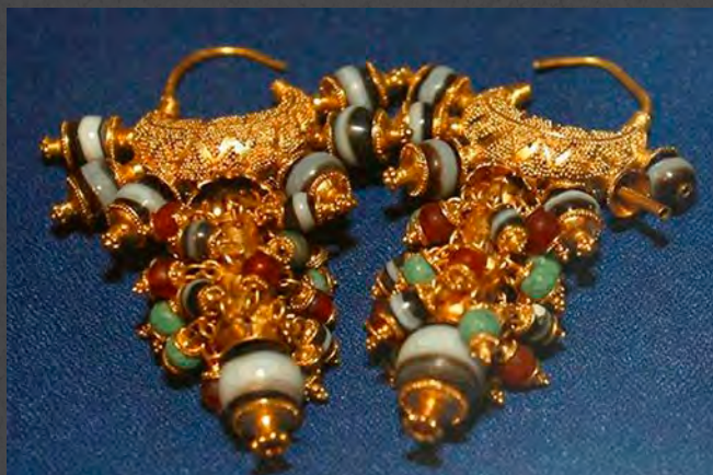
Gránátalma alakú gyöngyökkel és drágakő berakásokkal díszített arany fülbevalók a kalhú királynősírokból (Kr. e. 8. század közepe)