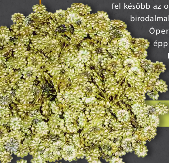
Rozetta alakú arany ruhadíszítések a kalhú királynősírokból (Kr. e. 8. század közepe)