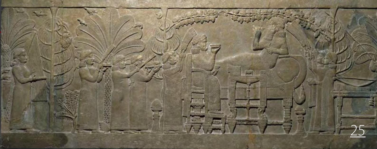
Szőlőlugas-jelenet a trónon ülő királynővel és a klinén fekvő uralkodóval. Dombormű Assur-bán-apli ninivei palotájából (Kr. e. 668–631)

más és más felcsavarási technikákat használtak, így a felső sálruha más-más stílusban helyezkedett el az uralkodón. Ezeket a különböző felcsavarási technikákat sajnos azonban a mai napig nem sikerült rekonstruálni. Mind a tunika, mind a felső sálruha anyagát jellemzően színes hímzéssel vagy a ruha anyagába bevarrt kis méretű arany vagy ezüst fémdíszekkel dekorálták. Ezek az úgynevezett brakteáták a bekarcolt díszítések formájában mutatkoznak meg a domborműveken ábrázolt ruhák felületén.