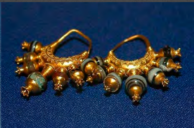
Arany fülbevalók a kalhú királynősírokból achát és karneol berakásos, gránátalma alakú gyöngyökkel (Kr. e. 8. század közepe)

az ide betelepülő néphullámok rendszerint gyors ütemben vettek át. Az általánosan használt ruhadarabok ráadásul az évszázadok során rendkívül lassan változtak, és ezek a változások is inkább az addig meglévő ruhatár bővülését jelentették új darabokkal. A szűk háromezer év alatt mindössze két jelentős módosulást tapasztalunk. Az első nagy váltás az úgynevezett lepelruhák viselésének első időszak után történt, kb. az Akkád Birodalom regnálása alatt (Kr. e. 24. század második fele), amikor is megjelent az úgynevezett tógaruha. A második pedig a Kr. e. 2. évezred második felére tehető, amikor is a tunika viselete terjedt el széles körben. Alapvetően az ekkor kialakult viseletet hordják ma is tradicionális öltözetként például Irakban.