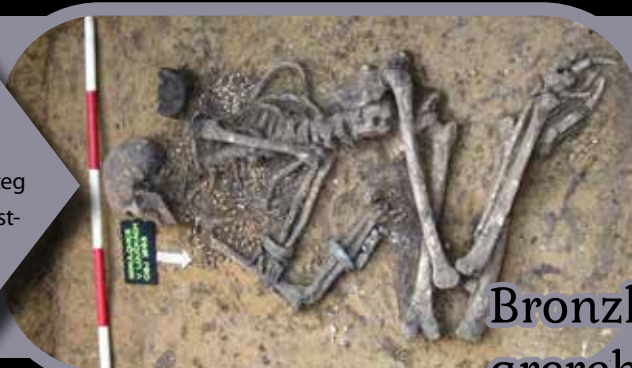
Bronzkori arc-rekonstrukció Csehországban

A csehországi Mikulovice környékén egy késő bronzkori temetőt tártak fel a régészek. A legjobb megtartású koponyával rendelkező, bronz karperecekkal, arany fülbevalóval, bronztűkkel és rengeteg borostyánnal eltemetett nő arcáról rekonstrukció is készült. A DNS-vizsgálatok szerint a haja és a szeme barna, míg bőre világos volt. A nő valamikor Kr. e. 1880 és Kr. e. 1750 között élehetett.