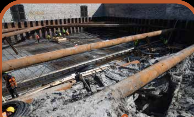
Középkori hajóroncs Észtországban

Az észti főváros, Tallinn kikötőjének közelében zajló építkezés kezdetén már tudtak egy 13. századra keltezhető hajóroncsról. Azonban a második, kitűnő állapotban fennmaradt hajómaradvány már nagy meglepetést okozott. A 24,5 méter hosszú, 9 méter széles hajó az előzetes dendrokronológiai vizsgálatok szerint a 13. század végén, 14. század elején épülhetett, de a pontosabb kormeghatározáshoz további vizsgálatokra van szükség.