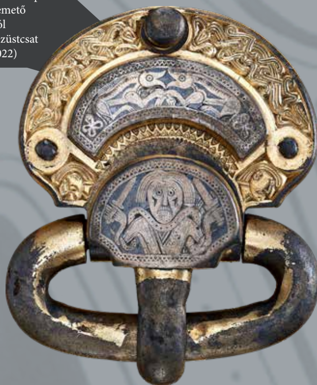
A kölked-feketekapui avar kori temető 119. sírjából származó ezüstcsat