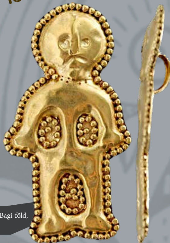
Rákóczifalva-Bagi-föld, 8/A lelőhely

Az avar kor első felének (6. század vége – 7. század) tárgyain ritkán jelennek meg emberábrázolások, csupán néhány övcsaton, övvereten, illetve szíjvégen, fibulán és csonttárgyon fordulnak elő egész alakok vagy emberi arcok. E képek különböző kultúrkörök lenyomatát tükrözik: találunk köztük Meroving-germán képtípust (pl. a kölked-feketekapui avar kori temető 119. sírjából származó ezüstcsat), bizánci import vagy mediterrán stílusú darabot (ilyen a hajdúdorogi, szakállas férfifejet ábrázoló övcsat) és steppei típusú ábrázolást is (pl. a noszai csonttárgyon látható bekarcolt férfialakok). A 8. századi díszítőművészetbe, az öntött bronz övveretek motívumkincsébe azonban már szilárdan beépültek az antropomorf elemek, amit a vadászat, állatküzdemi jelenet vagy lovaglás közben bemutatott figurák, valamint a mediterrán stílusú császárportrét utánozó veretek sora is mutat. A késő avar kultúra csúcsterméke a nagyszentmiklósi aranykincs, amelynek két korszóján is feltűnnek változatos tevékenységeket végző emberi alakok.