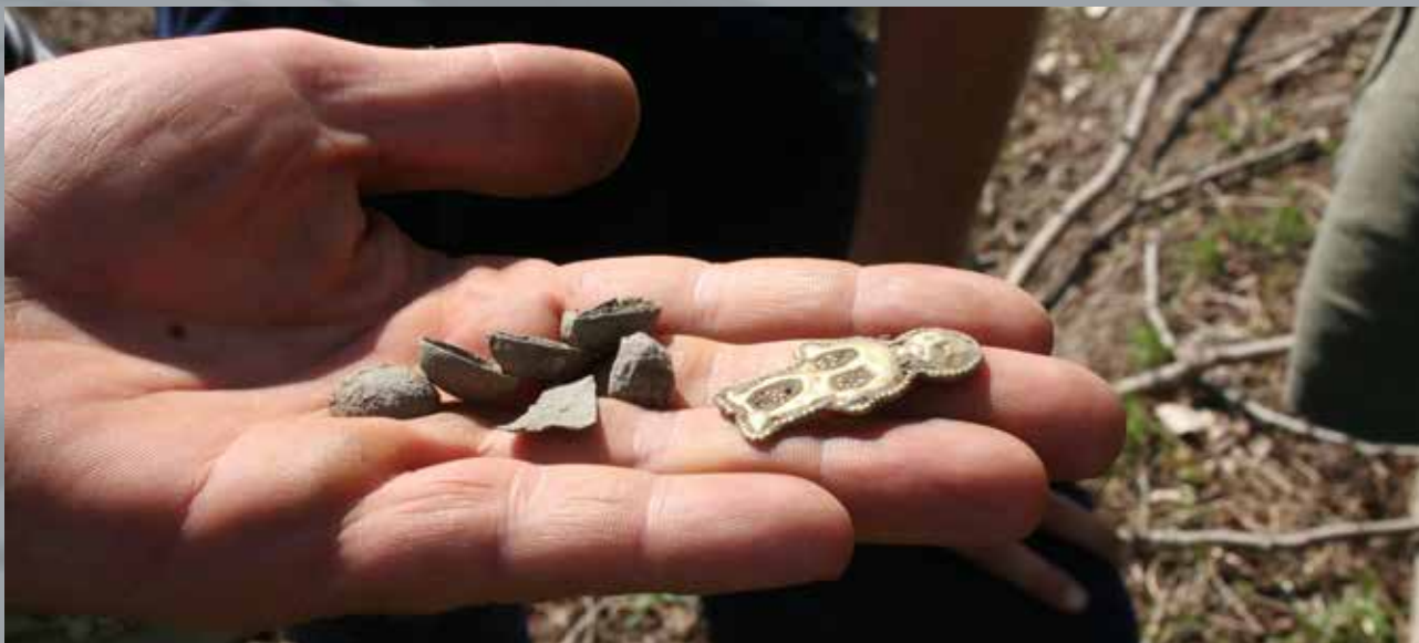
Arany emberalakú csüngődísz Rákóczifalváról

Az egész alakokról az emberi arcokra áttérve, a 6–7. században a hun koriakhoz hasonló, szembenéző emberfej ábrázolás szinte teljesen ismeretlen. Kivételt jelentenek a csengődi aranyozott bronz övvereteken látható csúcsos sapkás, nagy fülű és széles orrú emberfejek. Az önálló arcábrázolások mellett a motívum azonban számos kistárgyon felbukkan még, így pl. az emberi arc vagy annak elemei mind a bizánci, mind a germán típusú övveretek motívumkincsének a részévé váltak. A késő avar korban az arcábrázolás hagyományát folytatják az arcos csörgők is. Ezek nagyjából gyermeksírokból származnak, de előfordulnak férfi- és női temetkezésekben is, továbbá lószerszámot is díszíthettek velük. Míg a díszítetlen vas- és bronzcsörgők elsősorban szegényesebb temetkezésekből kerültek elő, az emberarcos példányok egy része kifejezetten gazdag lovas, veretes lószerszám vagy övveretes sírban feküdt (pl. Komárom-Hajógyár). Az avar sírok csörgőleletei arról tanúskodnak, hogy – elsősorban a gyermekek – rontást űző célból viseltek csörgőt az övükön, a csuklójukon avagy a nyakukban. Hasonló lehetett a lovak kantárjára akasztott csörgők funkciója is. Az állatokra aggatott harangok és csörgők szokása igen széles körben elterjedt, a csörgős lószerszám pedig elsősorban az előkelők körében volt jellemző. Ennek a szokásnak a meglétét bizonyítja néhány késő avar sírból származó csörgős kantár is. A lószerszámhoz tartozó emberfejes csörgőkkel kapcsolatban