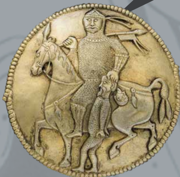
Emberábrázolás a nagyszentmiklósi kincsről („a győztes fejedelem”)

Az egész alakos, statikusan ábrázolt antropomorf figura a késői avar ötvösművészetben is fel-felbukkan. Kassa-Zsebesről ismerünk egy bizánci típusú, gombos végű szíjvéget hasonló emberalakokkal díszítve, ezen kívül a női övről lefüggő (tarsoly)korongoknak is jellegzetes, ám ritkán alkalmazott díszje volt (Tiszafüred, Tiszaderzs).