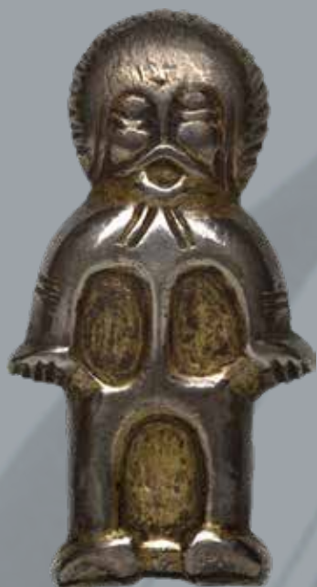
Ezüst emberalak, valószínűleg nyeregveret a Magyar Nemzeti Múzeum gyűjteményéből, ismeretlen lelőhely