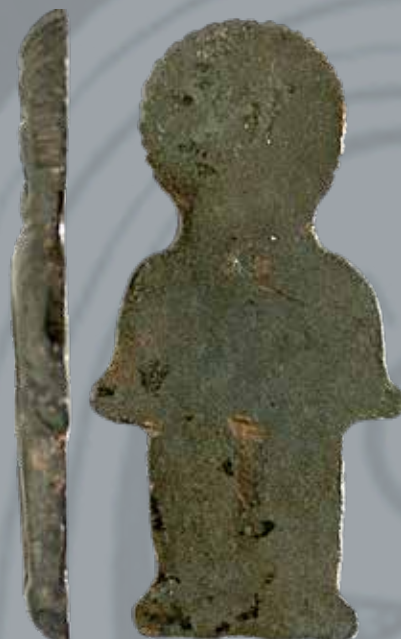
Paks-Gyapa 15. lelőhely

ták is felbukkannak köztük. László Gyula az ukrainai martynivkai és a Mala Pereščepinaó-i kincsben lelt állat- és emberalakos vereteket nyeregkapadíszként rekonstruálta. Ehhez kapcsolódóan meg kell még említenünk, hogy az antropomorf figurák gyakran nem önállóan, hanem összetett képként jelennek meg: a Közép-Dnyeper és a Kaukázus térségéből is ismerünk olyan leletegyütteseket, ahol az emberalakok szembenéző állatfigurák (pl. lovak, orosz-lánypár) között kapnak helyet.