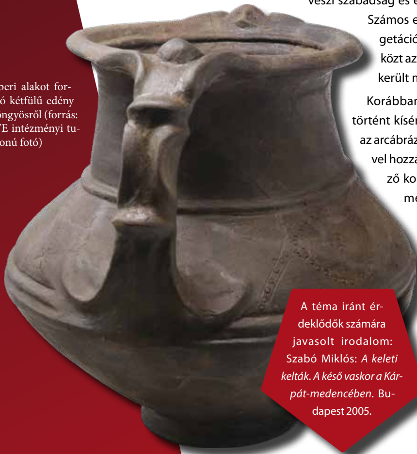
Emberi alakot formáló kétfülű edény Gyöngyösről

A téma iránt érdeklődők számára javasolt irodalom: Szabó Miklós: A keleti kelták. A késő vaskor a Kárpát-medencében . Budapest 2005.