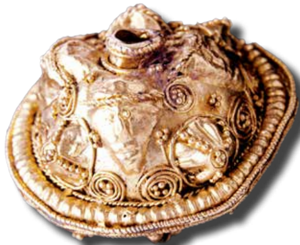
Emberi maszkkal díszített aranygyöngy Regöly határából. A Kr. e. 2. században készült szárazd-regölyi kincslelet legérdekesebb darabjai a maszkos aranygyöngyök. Bár a kincslelet egyes részei balkáni készítésre utalnak, a maszkábrázolás legközelebbi párhuzamai a Kárpát-medence kelta művészetéből ismertek

A kardhüvelyvésetek általában rendkívül összetettek és bonyolultak, értelmezésük alapos megfigyelést igényel. A növényi indák és levelek tekervényes szövevényében rendkívül elvont módon ábrázolva rejtőzködő emberi arcok/maszkok is előfordulnak. Művészeti szempontból ezt úgy értelmezhetjük, hogy a vésett díszítésű kardhüvelyeken az emberi arc „növényesítése” a jellemző. Másképp fogalmazva: a növényi indák közepette olyan emberi arc- és maszkmotívumokat fedezhetünk fel, amelyeket növényi díszítés ölel körül. A nehézség csupán abból adódhat, ha a domináns díszítőelemek elrejtik