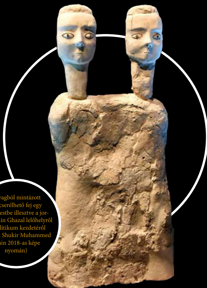
Agyagból mintázott két cserélhető fej egy közös testbe illesztve a jordániai Ain Ghazal lelőhelyéről a neolitikum kezdetéről

luszjegyekkel kísért formában. Ezek után a gondolkodási folyamat újabb szintjét jelentette az, amikor a korábban külön-külön kezelt környezeti és tárgyi elemek belső képei egy-egy egyéges, szintetizált képpé álltak össze. Egy további nagy előrelépés pedig az lehetett, amikor a közvetlenül meg nem tapasztalható tárgyi elemek, állatok, személyek, sokszor pedig a közösségi kommunikáció szimbolikus jelei szintén egy nagy belső „világképet” hoztak létre az emberi agyban. Ez a metafizikus, közösségileg megidézhető képi világ ugyanakkor egy olyan teret jelenített meg az élők számára, amelyben más, sokszor kiismerhetetlen szabályok érvényesültek, s így a mindennapi emberek számára veszélyeket rejtett magában. Ebben a térbe belépve például az egykor élők elveszíthették az arcukat, amint ez az elhunytak elkorhadó testén, arcán világosan megtapasztalható volt, ráadásul ebből a „másik világból” való visszatérés csak bizonyos kitüntetett személyeknek sikerülhetett. Az álarcot viselő, s a való világ és a túlvilág között „utazó”, s a kettő között közvetítő „specialisták”, a korai sámánok voltak azok, akik bizonyos közösségi rítusok keretében időről időre megidéztek ezt a másik világot. Lényegében ilyen ünnepi alkalmak helyszínékként értelmezhetők tehát a Trois-Frères barlang és Göbekli Tepe megalitikus kőépítményei. A maszkok ezekben a bemutatott régészeti