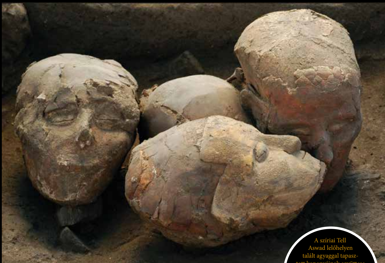
A szíriai Tell Aswad lelőhelyen talált agyaggal tapasztott koponyáinak együttese a neolitikum kialakulásának kezdetéről (Harward University, Shelby White and Leon Levy Program for Archaeological Publication, Fig. 1. nyomán)

vadászó-gyűjtögető életforma körülményei között. A gondolkodás minőségi átalakulását Clive Gamble abban látta, hogy a szociális csoportok kapcsolati határai néhány tízezer év alatt térben és időben drámaian kiterjedtek. Ez valójában azt jelentette, hogy egy adott közösséghez tartozóknak számítottak ezután azok az egyének is, akik nagy távolságban, a mindennapi vizuális érintkezés körén kívül voltak. Ugyanígy kiterjedt a közösségi kapcsolatrendszer a múltbeli halott egyénekre is. Ha ennek a körülménynek mélyebben utánagondolunk, akkor ez azt jelenti, hogy egy olyan új közösségi tér jött így létre – jelentősen kibővítve a mindennapok érzékelhető térért –, amiben a távoli és a múltbeli, sőt a remélt jövőbeli szereplők együtt jelenhettek meg. Tudjuk, hogy az őskor korábbi időszakának kognitív fejlődése nyomán ki kellett alakulnia a formatartó köeszközökről alkotott belső, hosszabb távú memóriában őrzött képeknek, hiszen csak ez tette lehetővé, hogy egyes őskori emberek és embercsoportok e belső mintákat követve, a tárgyaikat újra és újra reprodukálni tudják ugyanazon stí-