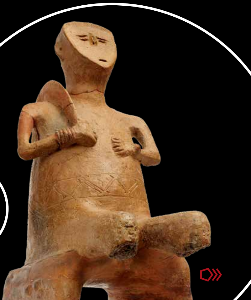
A dél-alföldi Szegvár-Tűzköves neolitikus települési halmán feltárt zsámolyon ülő, maszkot viselő férfi agyagszobra, a jobb vállán viselt sarlóval

A mai szakmai közvélekedés azt tartja, hogy a neolitikum kezdetén egy-egy múltbéli, fontosnak vélt személyiség lényegét hordozó koponya házakba való elhelyezésével együtt a hozzájuk kötődő egyéni történetek is közösségivé váltak. Ilyen módon tulajdonképpen egy mitikus múlt, a kollektív emlékezet megteremtésének eszközrendszerét szolgáltatták, s maguk a kiválasztott és időtállóvá tett koponyák a narratív történetek egy-egy hivatkozási alapját nyújtották. Ugyanakkor ezek az épületekhez kötődő különös „családi arcképcsarnokok” – az élő közösség reményei szerint – biztosították az arcképek mögötti transzcendens világ támogatását is. A mobil maszkok segítségével vélhetően egy-egy halott őst élő szereplők eleveníthettek meg alkalmanként, s a velük kapcsolatos történeteket, talán másokéval együtt, zenés, táncos közösségi performanszokban adhatták elő. Az anatóliai Çatalhöyük neolitikus településén feltárt