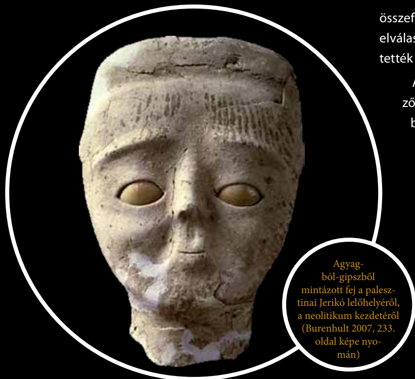
Agyagból-gipszből mintázott fej a palesztinai Jerikó lelőhelyéről, a neolitikum kezdetéről (Burenhult 2007, 233. oldal képe nyomán)

összefüggésekben tehát egy szélesebb, rétegzett világ elválasztó zónájának egy-egy kis határfelületét testesítették meg.