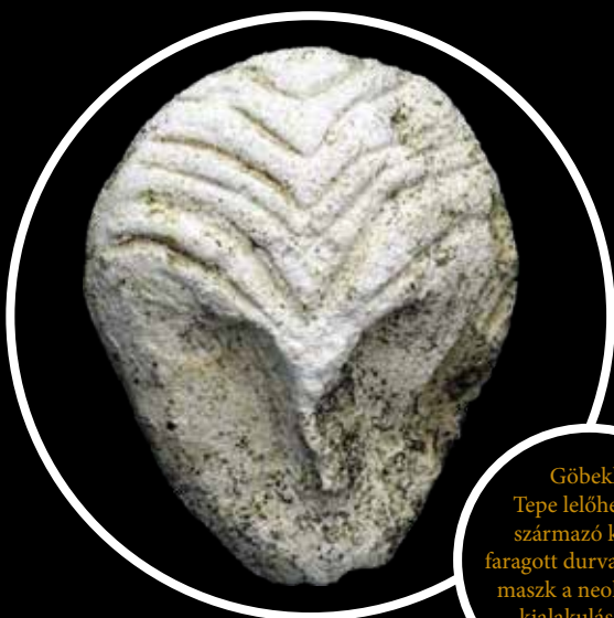
Göbekli Tepe lelőhelyről származó kőből faragott durva emberi maszk a neolitikum kialakulásának kezdetéről

De vajon mik azok a jellemzők, amik a földrajzi távolság ellenére (Európa és a Közel-Kelet) szembetűnő hasonlóságot jeleznek az előbbieken kiemelt jégkor végi két lelőhely (Trois Frères-barlang és Göbekli Tepe) régészeti értékelésénél? Mindkét esetben a mindennapok életterétől elkülönülő helyszínnel szembesülünk, az egyik egy természetes barlang sötét belső környezetében, a másik egy mesterségesen épített monumentális architektúra „színpadán”. Mindkét esetben az így használt tér falait bizonyos ikonográfiai szabályok rendszerében létrejött díszítések fedik, ráadásul e terekben bizonyos koegráfia szerinti közösségi események bizonyítékait fedezhették fel. A rekonstruálható események egyik fontos mozzanatát mindkét esetben álarcot viselő, s talán teljes testüket is álcázó különleges személyek jelenléte, aktív részvétele képezte.