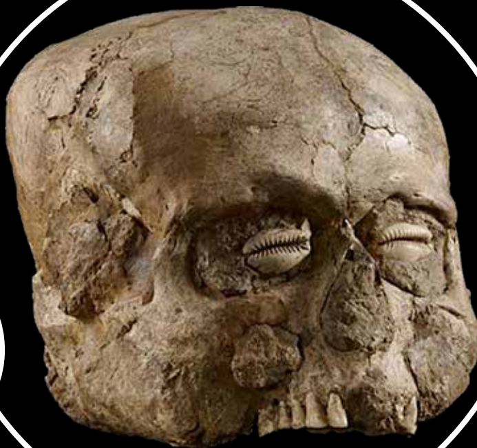
Az arc részén agyagtapasztással és a szemek helyére beültetett kagylóval díszített koponya a palesztinai Jerikóból a neolitikum kialakulásának kezdetéről (Ashmolean Museum, Oxford nyomán)

A felsorolt régészeti példák háttérben egy nagyon fontos emberi evolúciós változást sejt a régészettudomány kognitív kérdésekkel foglalkozó irányzata, s ez a változás a több millió éves emberré válás végső szakaszában, viszonylag rövid idő alatt következett be a vándorló