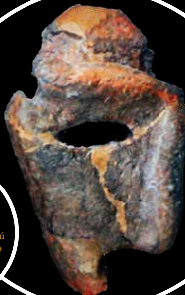
A Temesvár közeli Uivar/Újvár neolitikus települési halmán, egy ház alapozásából előkerült életnagyságú agyagmaszk kettétört, jobb oldali része (Schier 2010, Abb. 7. nyomán)

A kiterjedt Vinča kultúra és a kapcsolódó rokon kultúrkörök balkáni leletegyütteseiből igen nagy számban és változatosságban kerültek napvilágra emberi és állati agyagplasztikák, valamint edényeken megformált hasonló alakok. Ezek között igen gyakran fordulnak elő a maszkot viselő példányok, ami azt is jelenti, hogy a közel-keleti szellemi háttér bizonyos elemei, s annak tárgyi megformálása az élelemtermelő életmóddal együtt Európa déli részein szintén megjelentek. E különleges emlékcsoport első nagy hatású népszerűsítője Marija Gimbutas volt az 1970–1980-as években. Ő ezekben az állati és emberi alakokat mintázó plasztikákban különböző korai istenalakokat igyekezett rekonstruálni. Ebbe a gondolati körbe illeszkedett az az igazán egyedi agyagszobor, amely Szegvár-Tűzkövesen a Vinčával északról határos úgynevezett tiszai kultúra lelőhelyén került elő 1956 őszén. Ez a zsámolyon ülő, férfialakot formáló figura