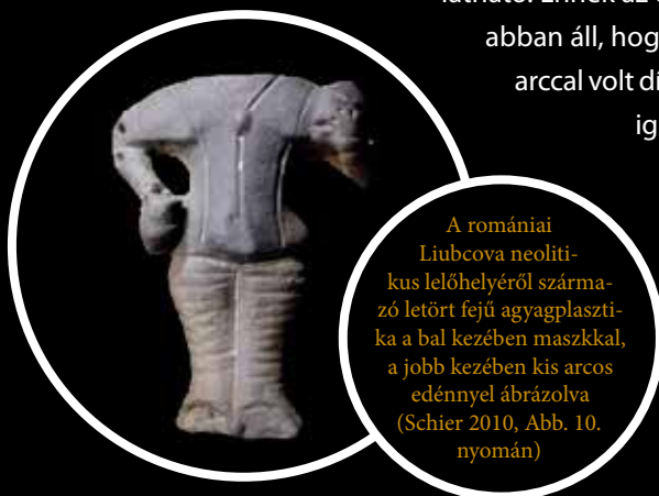
A romániai Liubcova neolitikus lelőhelyéről származó letört fejű agyagplasztika a bal kezében maszkkal, a jobb kezében kis arcos edénnyel ábrázolva (Schier 2010, Abb. 10. nyomán)

Rövid áttekintésünk esettanulmányai azt igyekeztek bemutatni, hogy az emberi arccal, vagy éppen az arc elfedésével kapcsolatos közösségi attitűdök már az újkőkori időszakában kultúráról kultúrára új megjelenésformákat és új gondolati kereteket körvonalaztak az általános vonások mellett a Közel-Kelettől egészen a Kárpát-medencéig terjedő nagy területen. Ebből következően magyarázatuk is csak az adott kulturális értelmezési tartományok keretei között oldható meg a tudományos módszertan követelményei szerint. Ez a szemléleti perspektíva érvényes a későbbi korok, így az írott források által (is) kísért időszakok történeti környezetére, a néprajzi megfigyelések gazdag analógiáira is. A téma mindezekén túl felveti a személyiség, az éntudat, az identitás, az ajándék és a maszkok messzire vezető komplex összefüggéseit, amire több remek ízelítőt kaphatunk többek között Claude Lévi-Strauss vagy Marcel Mauss sokszor hivatkozott klasszikus antropológiai munkáiból is.