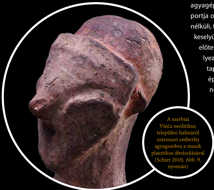
A szerbiai Vinča neolitikus települési halmáról származó emberfej agyagszobra a maszk plasztikus ábrázolásával (Schier 2010, Abb. 9. nyomán)

agyagépületek belső falán James Mellaart kutatócsoportja olyan festett képeket fedezett fel, amelyeken fej nélküli, táncoló pózban ábrázolt emberi alakok hatalmas keselyűfigurákkal együtt kerültek ábrázolásra. A falképek előterében, az épület padlóján emberi koponyákat helyeztek el, s a falakon őstulok- és kosfejek trófeaszerű tapasztott változatait formázták meg. E különleges épület belső terében régészetiileg megfogható neolitikus tárgyi elemek bizonyosan a helyi közösség Kr. e. 7. évezredi mitikus kerettörténetének egy-egy lényeges referenciaelemét képezték, ahhoz hasonlóan, ahogyan manapság egy rajzfilm történetének képsorozatából ki-merevíténénk egyetlen képkockát.