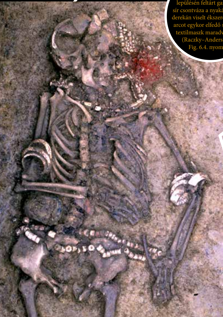
Polgár-Csőszhalom késő neolitikus településén feltárt gazdag női sír csontváza a nyakán, karján, derekán viselt ékszerekkel és az arcot egykor elfedő szemfedő, textilmaszk maradványaival (Raczky–Anders 2017, Fig. 6.4. nyomán)

A neolitikus maszkok és az akkori házépítés kapcsolatára meglepő régészeti leletösszefüggés utalt a Temesvár közeli Uivar/Újvár települési halmának ásatásán. Itt az egyik ház falának alapozásában egy életnagyságú agyagmaszk jobb oldali felét találták meg. A helyszíni megfigyelések nyomán gondolt az egyik ásató, Wolfram Schier arra, hogy itt a ház építését megelőzően egy maszkos rituális közösségi rendezvény valósulhatott meg, ami talán éppen a ház későbbi sikeres életét volt hivatva biztosítani. Ezt a feltételezést megerősíteni látszik a maszknak az épület anyagával egyező, durván kevert textúrája. Ezen túlmenően, a maszk alkalomhoz kötött, egyedi használatát éppen az mutatja, hogy az egykori szertartást követően a maszkot kettétörték. Az további célzatos és titokzatos koreográfiát sejtet, hogy a maszk másik fele hiányzik. Vajon mi történt vele, hová került, s ennek milyen további szimbolikus jelentése lehetett?