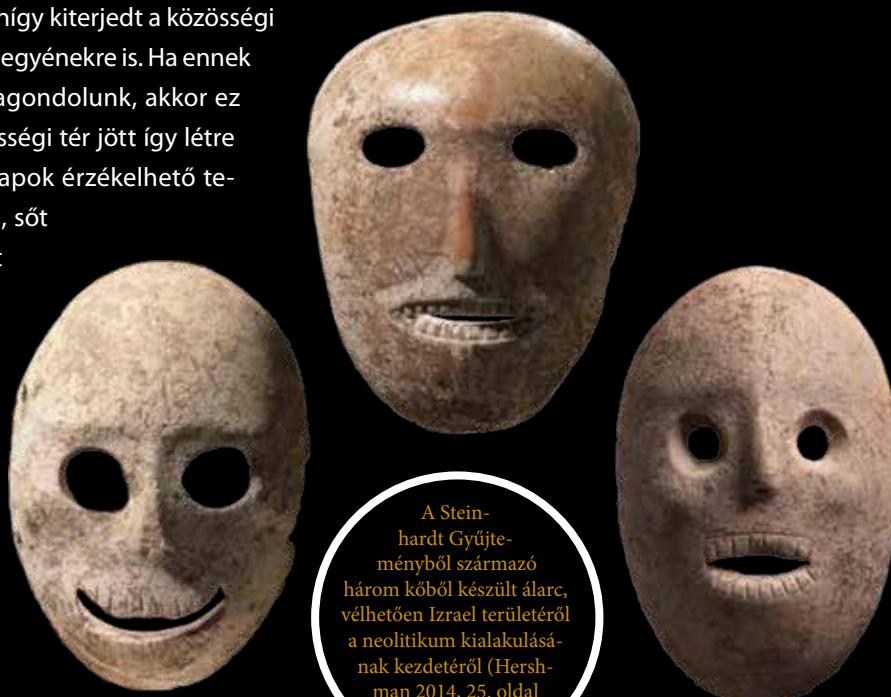
A Steinhart Gyűjteményből származó három kőből készült álarc, vélhetően Izrael területéről a neolitikum kialakulásának kezdetéről (Hershman 2014, 25. oldal képe nyomán)

vadászó-gyűjtögető életforma körülményei között. A gondolkodás minőségi átalakulását Clive Gamble abban látta, hogy a szociális csoportok kapcsolati határai néhány tízezer év alatt térben és időben drámaian kiterjedtek. Ez valójában azt jelentette, hogy egy adott közösséghez tartozóknak számítottak ezután azok az egyének is, akik nagy távolságban, a mindennapi vizuális érintkezés körén kívül voltak. Ugyanígy kiterjedt a közösségi kapcsolatrendszer a múltbeli halott egyénekre is. Ha ennek a körülménynek mélyebben utánagondolunk, akkor ez azt jelenti, hogy egy olyan új közösségi tér jött így létre – jelentősen kibővítve a mindennapok érzékelhető térért –, amiben a távoli és a múltbeli, sőt a remélt jövőbeli szereplők együtt jelenhettek meg. Tudjuk, hogy az őskor korábbi időszakának kognitív fejlődése nyomán ki kellett alakulnia a formatartó köeszközökről alkotott belső, hosszabb távú memóriában őrzött képeknek, hiszen csak ez tette lehetővé, hogy egyes őskori emberek és embercsoportok e belső mintákat követve, a tárgyaikat újra és újra reprodukálni tudják ugyanazon stí-