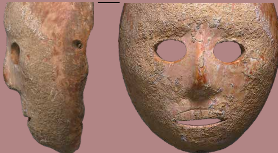
A Hébron mellett előkerült maszk