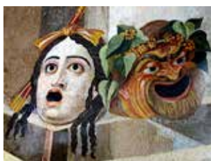
Görög színházi maszkok egy római mozaikon