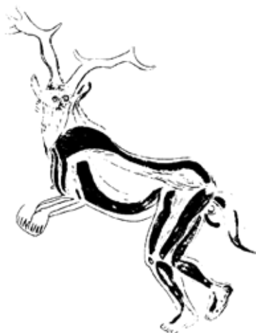
A Trois Frères-barlang „sámánja”