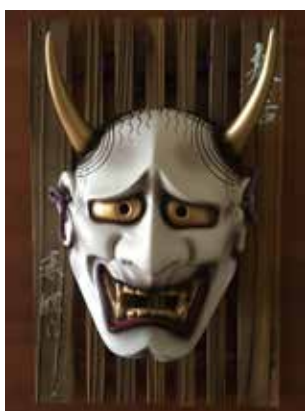
No színházi hannya maszk Japánból