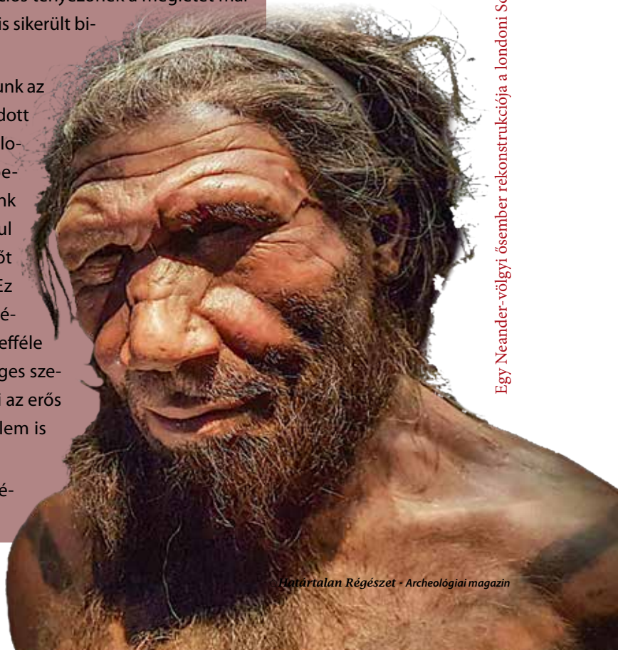
Egy Neander-völgyi ősember rekonstrukciója a londoni Science Museumban