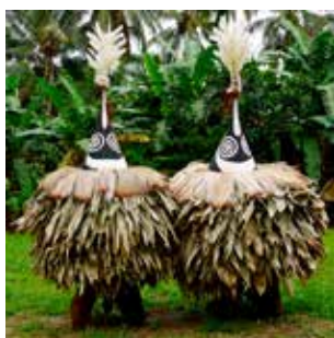
Új-guineai duk-duk/tubuan maszkok