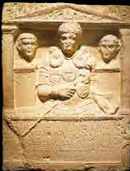
Marcus Caelius sírköve, amelyen az „elesett Varus csatájában” felirat olvasható

egységeket összpontosított támadásokkal morzsolták fel. A csatában különböző erődítések is fontos szerepet játszottak, a germánok az erdőben például földsáncokat húztak fel, melyek mögül biztonságosabban tudták elhajtani fegyvereiket és ahová akár vissza is tudtak húzódni, de a legiók is sikeresen létesítettek egy megerősített