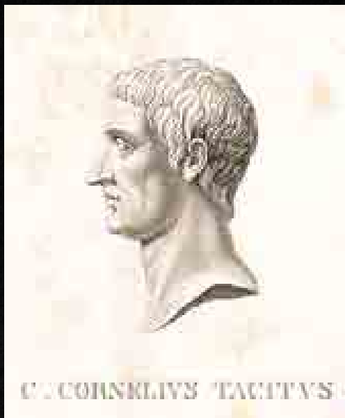
Publius Cornelius Tacitus római történetíró (55/56 – 117-120)

A szériában több, a római írók által a germánokról valóban feljegyzett ismeret is feltűnik, ami egyértelműen jelzi, hogy a sorozat készítői sok esetben