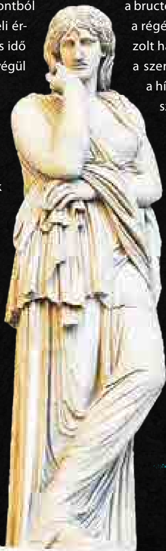
Thusnelda szobra Firenzében

A legnagyobb dicséret a Netflix barbárjait a kosztümök és felszerelések miatt illeti. A római katonák ruhája, páncélja és fegyvere nagyon jól tükrözi a korabeli viszonyokat, továbbá tartózkodtak a mármár klisének számító, viszont a filmekben gyakorta viselt céltalan bőr alkarvédőktől. A csata helyszínén talált egyik legfontosabb régészeti lelet, egy római lovassági sisakhoz tartozó bronz arcmaszok replikája is feltűnik a képernyőn. A germánok felszerelése is szerencsére nélkülözi a „filmes germán-skandináv” bőrgúnyákat, és helyette korhű, lenvászonból és gyapjúból készült tunikákat, nadrágokat és fibulával összefogott köpenyeket hordanak.