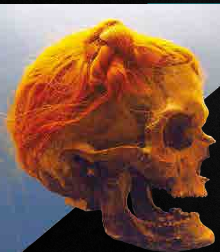
Az Osterby- (Németország) mocsárban talált halott hajviselete, az ún. szváb csomó