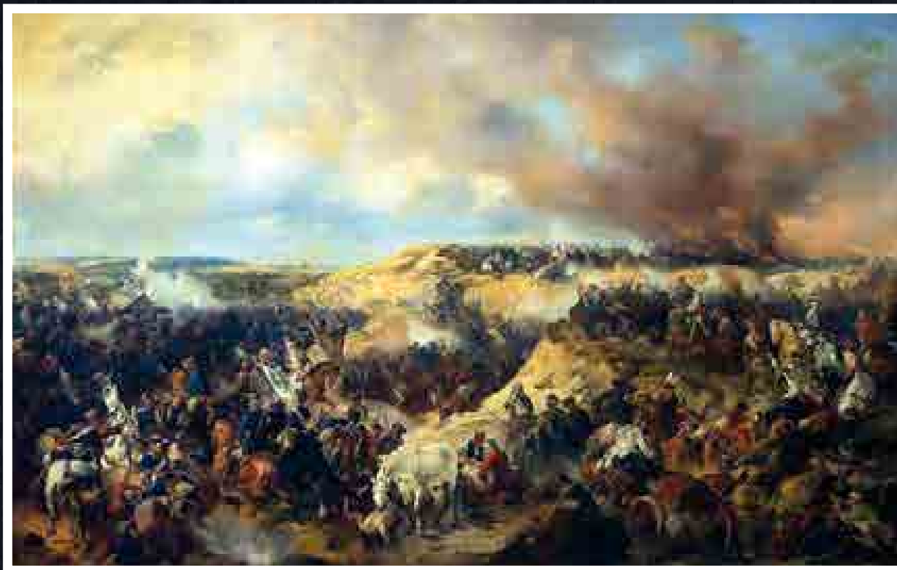
Alexander Kotzebue A kunnersdorfi csata (1759. augusztus 12-én) című festménye a hétéves háború egyik fontos ütközetét örökíti meg

a háború után sem, állandósult a forgalmuk. Bevezetésükkor a lakosság bízott bennük, kedvelték azokat, még 1–1,5 százalékos felár (ázsió) is kialakult a fém pénzekkel szemben. Ez egészen 1797-ig tartott, amikor is az elhúzódó háború és az utolsó kibocsátás mennyiségének eltitkolása megingatta a lakosság papírpénzbe vetett bi-