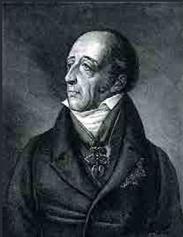
Philipp Stadion gróf, a konszolidáció egyik kulcsszereplője

Az új jegyeket névértéküknél alacsonyabb árfolyamon lehetett csak elfogadtatni, ami az árak gyors emelkedését eredményezte. Az állam a kiadásokat kölcsönrel igyekezett fedezni. A háború folytatódott, tovább nőtt az államadósság, s így további pénzmennyiségre volt szükség. A drámai devalváció tehát nem váltotta be a hozzá fűzött reményeket. Két évvel később új néven új pénzjegyeket hoztak forgalomba, az „előlegezési jegyeket” ( Anticipationsschein ). Fedezetük egy, a jövőben befolyó földadó (lett volna). A kibocsátási mennyiséget nem korlátozták, igény szerint kerültek forgalomba, ami az értéküket csökkentette.