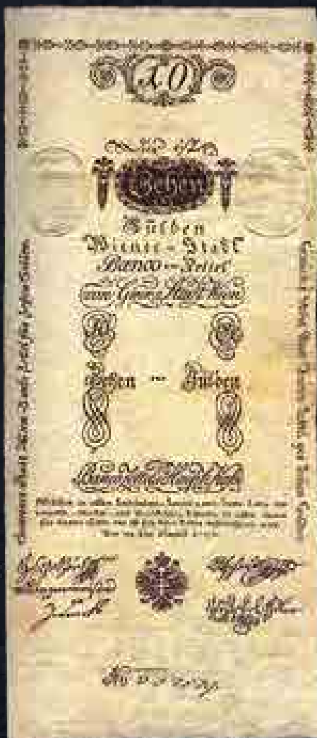
A Winer Stadtbank 1796-os 10 guldenes kibocsátása

A Napóleonnak fizetendő súlyos hadisarc is jelentősen megterhelte az amúgy is nehéz pénzügyi helyzetet. Magyarországot egyébként kevésbé sújtotta a háború, sőt a háborús konjunktúra előnyeit élvezte. A megnövekedett gabonai igényeket többnyire magyar földekről elégítették ki. A búza