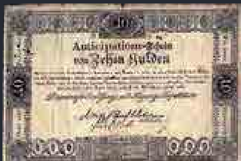
„Előlegezési jegy” ( Anticipationsschein ), 10 gulden, 1813

és egyéb gabonák ára így az inflációt messze meghaladó mértékben, 10–14-szeresére nőtt ezekben az években. Az infláció haszonélvezői tehát leginkább a hadsereget ellátó magyar gabonatermelő földesurak, kismemesek és kereskedők lettek.