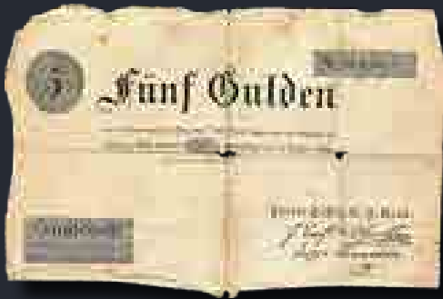
Az Osztrák Nemzeti Bank 5 guldenese 1816-ból