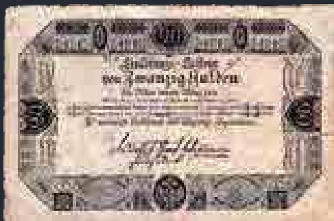
„Beváltójegy” ( Einlösungsschein ), 20 gulden, 1811