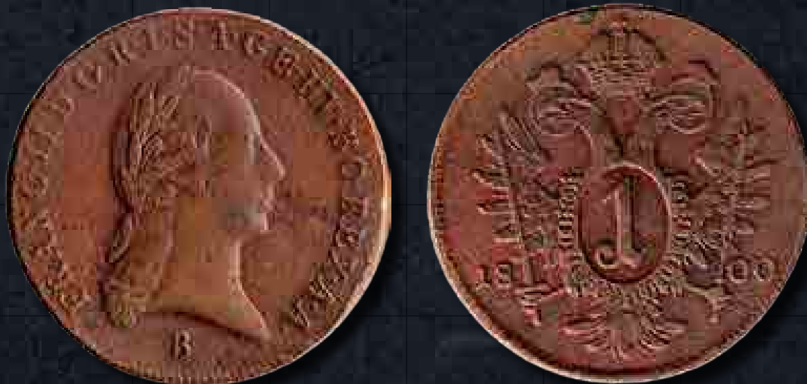
I. Ferenc 1 krajcárosa, kőrmöcbányai veret (Takk©2021)

zalmát; a bankjegyek fémpénzre váltását pedig felfüggesztették. A kétféle pénz értéke rövid ideig azonos volt, majd egyre inkább eltolódott az ezüst javára a valós forgalomban, noha hivatalosan mindig is azonos volt az árfolyamuk.