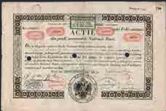
Az Osztrák Nemzeti Bank részvénye Beethoven nevére