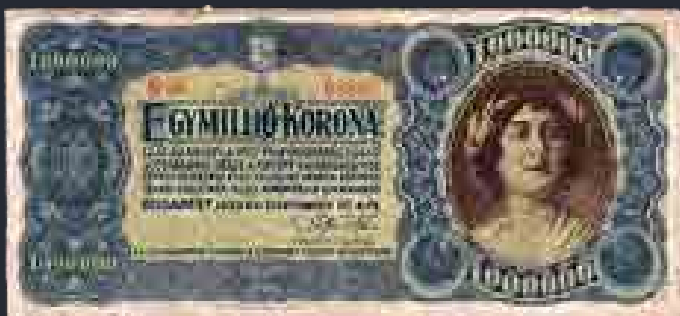
Egymillió koronás 1923-ból