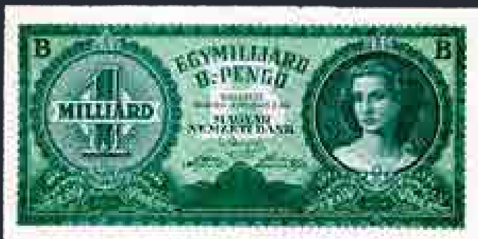
Egymilliárd B.-pengős 1946-ból

A Ludas Matyi satirikus hetilap ára 1946-ban a következőképp alakult: