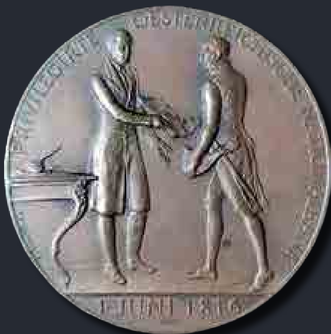
Az Osztrák Nemzeti Bank 1816-os alapítását ábrázoló emlékérem a 100 éves évfordulón

A piac végül csak lassan rendezte a pénzügyi viszonyokat. Mindez egészen 1848-ig tartott, amikor is a forradalmak hatására az emberek újra megrohmozták a pénzváltóhelyeket, hogy papírpénzekért ezüstpénzt kapjanak, majd ismét elrejtették az ezüstöket. S az árak akkor elkezdtek ismét emelkedni.