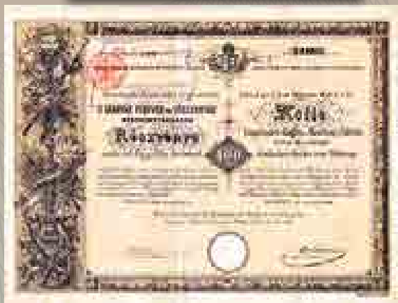
A Magyar Fegyver- és Lőszergyár Rt. részvénye 100 forintról, 1888

Magyarországon is a 18. század vége felé jelentek meg az első részvénytársaságok. Akkoriban csak uralkodói kiváltságlevél alapján működhetett részvénytársaság. Ennek oka az volt, hogy a különféle feudális köztétésekkel terhelt társadalomban számos privilégiumot (kiváltságot) kellett biztosítani egy társaság működéséhez. A Duna és a Tisza között létesített Ferenc-csatorna megépítésére alakult részvénytársaság számára például olyan privilégiumokat adtak ki, amelyek a terület kisajátítástól a munkaerőről való gondoskodáson át a szállítás jogokig mindenről részletesen rendelkeztek. A társaságot – amely egyike a legelső magyar részvénytársaságoknak – 500 forint névértékű részvények kibocsátásával Kiss József udvari kamarai mérnök hozta létre nagybirtokosok és bankárok részvételével 1793-ban, és huszonöt évre nyert kiváltságot a csatorna megépítésére és üzemeltetésére.