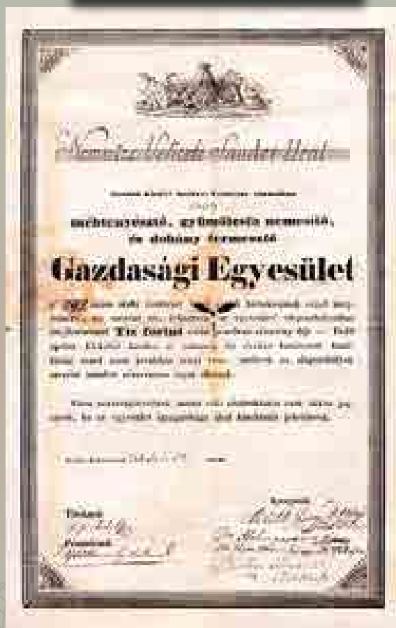
A Méhtenyésző, Gyümölcsfa-nemesítő és Dohánytermesztő Gazdasági Egyesület részvénye 10 forintról, 1840