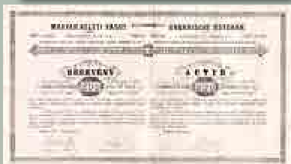
A Magyar Keleti Vasút részvénye 200 forintról, 1871