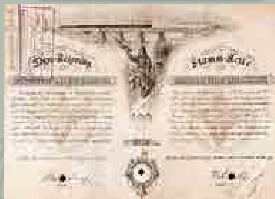
Az Újszász-Jászapáti Helyi Érdekű Vasút Rt. tőzsrészvénye 100 forintról, 1885