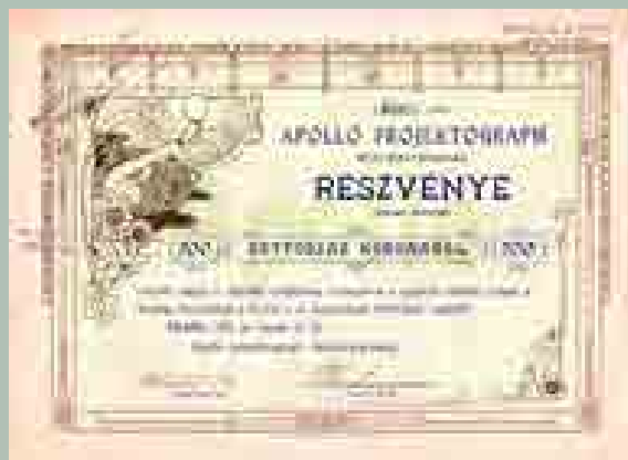
Az Apollo Projektograph Rt. részvénye 200 koronáról, 1912