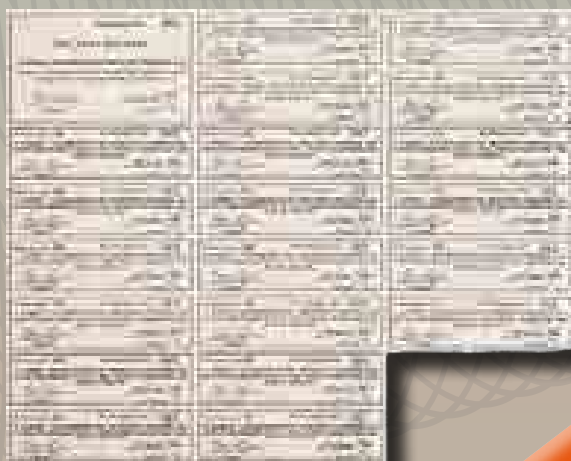
Szelvényív a Sümegi Takarékpénztár 1912-ben kibocsátott 602. számú részvényéhez

törzsrészvényeket azok számára, akik helyben laktak, s így számukra különösen fontos volt a vállalkozás sikere, míg másokat a plusz kedvezményekkel járó ún. elsőbbségi részvényekkel igyekeztek megnyerni.