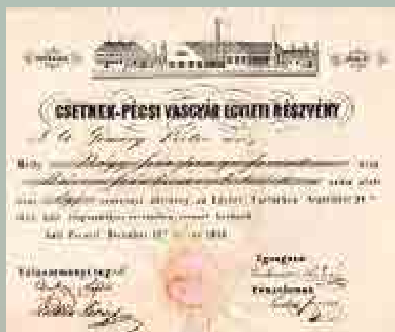
A Csetnek–Pécsi Vasgyár Egylet részvénye 400 forintról, 1844

A részvénytársaságok kezdetleges változatai azok a 17. századi hajózási társaságok voltak, amelyekhez több tulajdonos társult saját tőkével. Az összegyűlt pénzből finanszírozták a hajókat és az árukat a távolsági kereskedelem céljaira. A nyereséget csak tízévenként osztották fel, s közben újabb befizetéseket tettek, ha az üzlet megkívánta. A Habsburg Birodalomban, így