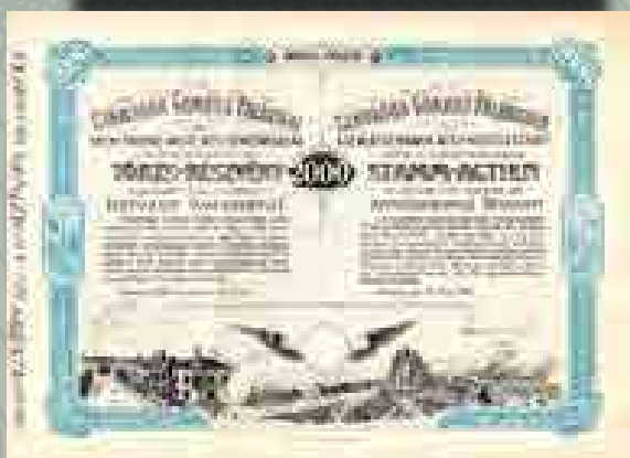
A Szabadka-Gombos-Palánka Helyi Érdeklő Vasút Rt. tíz összevont törzsrészvénye egyenként 200 koronáról, 1908