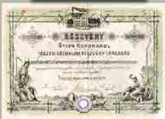
A Tószegi Gőzmalom Rt. részvénye ötven koronáról, 1893