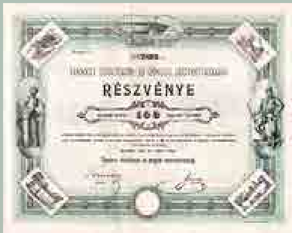
A Tarnóczy Tűzoltószert- és Gépgyár Rt. részvénye 100 forintról, 1894