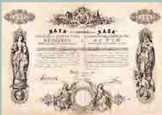
A Haza Életbiztosító és Hitelbank Rt. részvénye 200 forintról, 1872