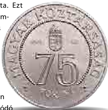
Ezüst 75 forintos emlékpénz a Magyar Nemzeti Bank alapításának 75. évfordulójára, 1999 (Magyar Pénzverõ Rt.)

Világszerte a múzeumok különleges csoportját képezik a jegybanki múzeumok gyűjteményei, tárlatai. Ezek célja lehet értékõrzés, támogatás, de – főleg a kereskedelmi bankok esetében – befektetés is. Bár más tematikájú, például képzõművészeti gyűjtemények is gyarapíthatják a jegybankokat, jellemzően pénz- és banktörténeti gyűjtemények adják a jegybanki múzeumok gerincét. A numizmatikai gyűjtemények túl azon, hogy a fizetőeszközök (pénzek, pénzhelyettesítõk) fejlődését, megjelenési formáit tudják bemutatni, segítenek napjaink pénzügyeinek megértésében is. A Magyar Nemzeti Bank „múzeuma” is igyekszik a látogatók változó igényeit kielégíteni. A pénzügyi kultúra, a tudatos pénzügyi gondolkodás, a döntés-elõkészítés fejlesztése a jegybank egyik kiemelt feladata. Ezt célozza számos múzeum-pedagógiai foglalkozás is akár a történeti gyűjtemény anyagának felhasználásával. Az állandó és idõszaki kiállítások zömmel a bank székházában vagy az ahhoz kapcsolódó épületekben ingyenesen látogathatók. Már a jelenlegi