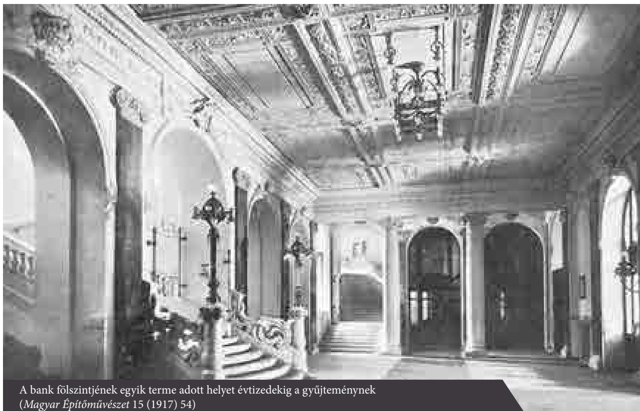
A bank fõlszintjének egyik terme adott helyet évtizedekig a gyűjteménynek (Magyar Építõművészet 15 (1917) 54)

Világszerte a múzeumok különleges csoportját képezik a jegybanki múzeumok gyűjteményei, tárlatai. Ezek célja lehet értékõrzés, támogatás, de – főleg a kereskedelmi bankok esetében – befektetés is. Bár más tematikájú, például képzõművészeti gyűjtemények is gyarapíthatják a jegybankokat, jellemzően pénz- és banktörténeti gyűjtemények adják a jegybanki múzeumok gerincét. A numizmatikai gyűjtemények túl azon, hogy a fizetőeszközök (pénzek, pénzhelyettesítõk) fejlődését, megjelenési formáit tudják bemutatni, segítenek napjaink pénzügyeinek megértésében is. A Magyar Nemzeti Bank „múzeuma” is igyekszik a látogatók változó igényeit kielégíteni. A pénzügyi kultúra, a tudatos pénzügyi gondolkodás, a döntés-elõkészítés fejlesztése a jegybank egyik kiemelt feladata. Ezt célozza számos múzeum-pedagógiai foglalkozás is akár a történeti gyűjtemény anyagának felhasználásával. Az állandó és idõszaki kiállítások zömmel a bank székházában vagy az ahhoz kapcsolódó épületekben ingyenesen látogathatók. Már a jelenlegi