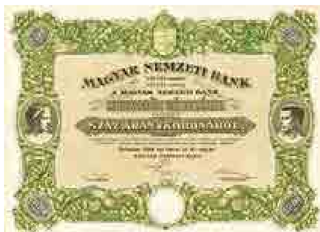
A Magyar Nemzeti Bank száz aranykorona részvénye, 1924 (MNM©2021)

történeti képet nyújtva a látogatóknak. 1998-ban az 1848–49-es forradalom és szabadságharc évfordulója alkalmából rendezett tárlat nyitotta meg a tematikus kiállítások sorát. 1999-ben a bank 75 éves évfordulója adott alkalmat, 2000-ben pedig az új szerzemények álltak a középpontban. A következő évben egy, a nagyközönség által kevésbé ismert terület, a történeti értékpapírok világa