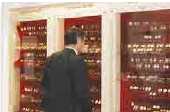
Részlet az egyik korábbi kiállításból