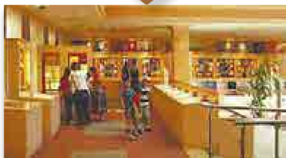
2004 és 2014 között a bank Látogatóközpontjában állandó pénz- és banktörténeti kiállítás várta a látogatókat