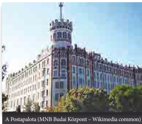
A Postapalota (MNB Budai Központ – Wikimedia common)