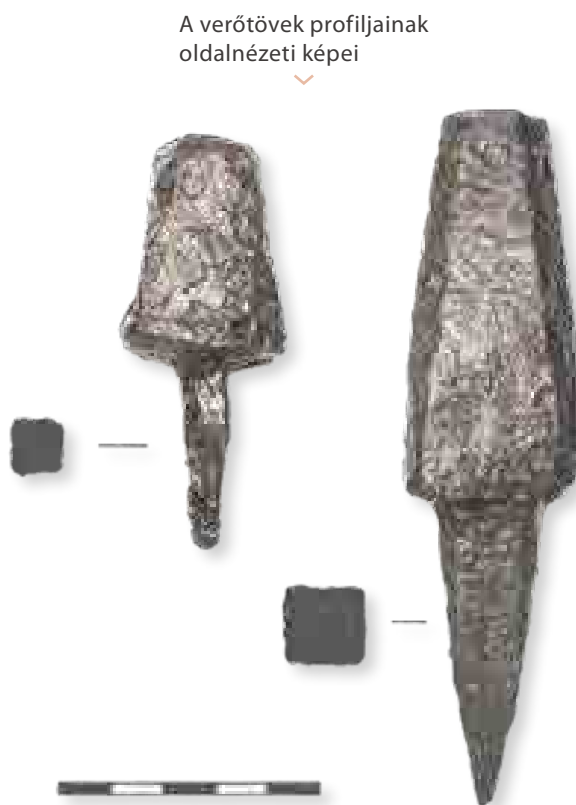
A verőtövek profiljainak oldalnézeti képei

A verőtövekről sajnos nem állapítható meg, hogy milyen pénzek készítésére szolgáltak. Mindkét szerszám megmunkálatlannak tűnik, bár az egyiknek egy centrikusan bevésített, szabályos kör jól kivehető (ennek átmérője 13 mm). A kisebbik verőtő hosszúsága rögzítő tuskéval együtt mintegy 75 mm, a profil átmérője kb. 20 mm, míg a nagyobbik szerszám teljes hossza 130 mm, a profil átmérője pedig 20 mm. Talán még vésésre váró, vagy a körvonallal rendelkező darab esetében éppen félkész szerszámokról beszélhetünk (egyébként mindkettő alsó verőtő).