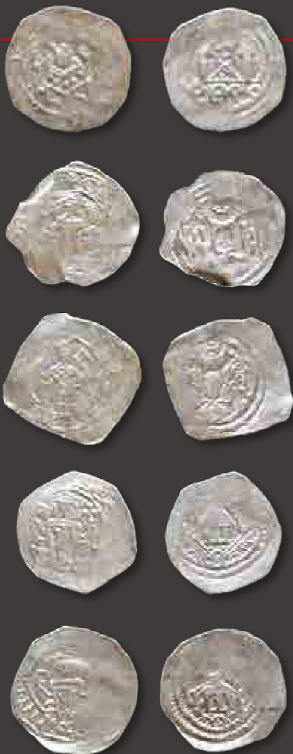
A 21. számú objektumban előkerült éremkincs darabjai

Az előkerült leletek tehát egy pénzverde jellegzetes leletanyagát mutatják, így jogosan állapítható meg, hogy valamikor a tatárjárást megelőzően pénzverő helyként működött az említett épület. Magyarországon mindeddig nem tártak még fel olyan pénzverdét, ahol verőtövek is előkerültek volna, így a Sibrik-dombon talált leletegyüttes különösen figyelemre méltó. Az Árpád-korból eddig mindössze néhány pénzverő szerszámot ismertünk, így ez a leletcsoport e tekintetben is meglehetősen fontos.