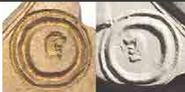
A lemez vésete és plasztilinlenyomata