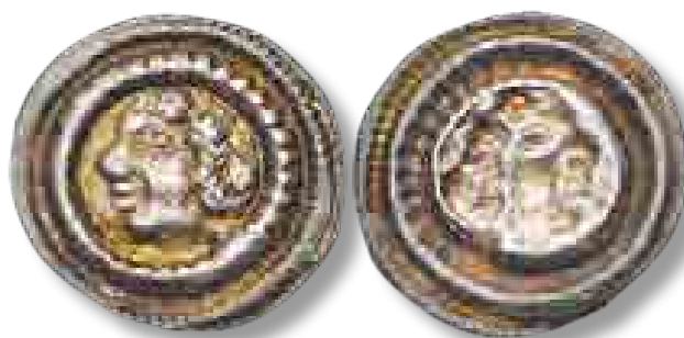
A CNH 272-es lemezpénz egy példánya

Ezek mellett találtak még vasszögeket és egy kést is, valamint egy mérleget, továbbá egy öt friesachi denárból álló éremkincset is: többek között Csehországi Adalbert (1168–1177, 1183–1200) érsek és II. Eberhard (1200–1246) érsek vereteit a friesachi verdéből.