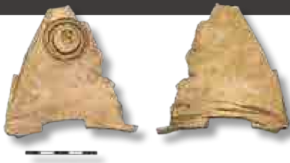
A lemez a 21. számú objektumból

A lemezdarab megmunkálása olyan, mintha verőtövek szánták volna. A középkori verőtövek jellemzően vasból készültek, és hosszabb – legalább 5–10 cm-es – vashengerek voltak, ahogyan azt például az itt előkerült két darabon is láthatjuk. A magyar középkorból azonban szép számmal ismerünk bronzból készült verőtöveket amelyeket az ötvösmesterek használtak például gombok, vagy ékszerek készítéséhez (többek között Monostorszegen és Versecezen is leltek ilyeneket). A Magyar Nemzeti Múzeum Éremtárában található egy bronzlemez, amely szintén egy lemezpénz éremképét hordozza. De szép számmal hozhatók német, illetve cseh, valamint morva példák is a bronz verőtövek használatára.