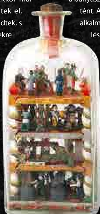
▶ Bányász témájú türelempalack, jól látható rajta a történeti bányászat ( montanisticum ) teljes vertikuma: bányászat, érclőkészítés és kohászat, pénzverés (Körmöcbánya – 19. század eleje), Soproni Múzeum Központi Bányászati Múzeum

1627-ben Selmecebányán a Felső-Bieber-táróban végezték. Ez jelentősen gyorsította a kemény kőzetben való előrehaladást. A század közepétől új érclelőhelyeket is sikerült feltárni Selmecebányán, így az ezüstabányászat rövid időre újra fellendült. Az alsó-magyarországi bányaterület ezüsttermelése a 17. század végéig 26–30 ezer kg volt. Körmöcbánya aranytermelése viszont továbbra is alacsony