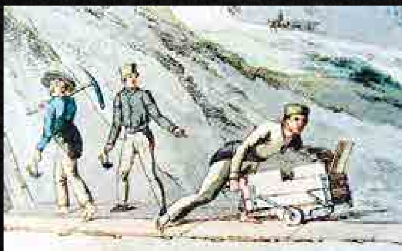
Magyar csille munkában (Bikkessy-Heimbucher rézmetszete, részlet). Ez egy 18. század végi állapotot ábrázol

A 17–18. század fordulójára ismét víz alá kerültek a még ércet tartalmazó, egyre mélyebben lévő szintek, azaz „elfúltak” a bányák. Ennek a politikai következménye volt, hogy a Rákóczi-szabadságharc nemesfémhiánnyal, s így pénzhiánnyal küzdött, s Rákóczi kénytelen volt rézpénzt kibocsátani. Minthogy a víztelenítést továbbra sem tud-