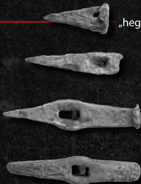
Bányászékek Rudabányáról (14–17. század)