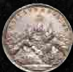
Steinville generális bányászati érme a zalatnai bányaheggyel, csúcsán az arany korabeli bányászati jegyével (nap) és a következő szinten az ezüstével (hold) (1710), Magyar Nemzeti Múzeum