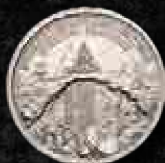
Selmechányi jutalomérem, bányaművelés. 1747-től 1780-ig rendeztek a Selmechányi Bányatiszti Iskolában versenyeket a hallgatók és az altisztek közt, s a győztes kapta meg az értékes aranyérmét, Magyar Nemzeti Múzeum