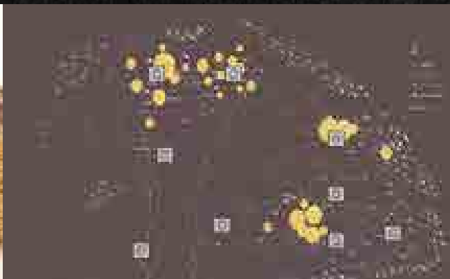
Nemesfémbányászat és pénzverés a Magyar Királyságban (1000–1918)

szinten stagnált, míg az Erdélyi Fejedelemséghez tartozó Szatmári bányavidék arany- és ezüsttermelése a század elején eredményesen működött. Az Erdélyi-érc-hegység bányászata is fejlődött különösen Bethlen Gábor fejedelem (ur. 1613–1629) intézkedéseinek köszönhetően.