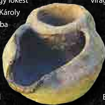
▲ Bányamécs Rudabányáról (15. század), Bányászattörténeti Múzeum

A 15. század második felére viszont nagyrészt kimerült Körmöcbánya aranykészlete, ezért a Mátyás-aranyforintok nagyobbik része már az ekkor virágkorát élő Nagybánya aranyából készült. A bányák mélysége miatt viszont nőtt a vízbetörések száma is, így gondoskodni kellett a víztelenítésről. Ezt a 15–16. század fordulóján Thurzó János, a korszak európai szinten is egyik legkiválóbb