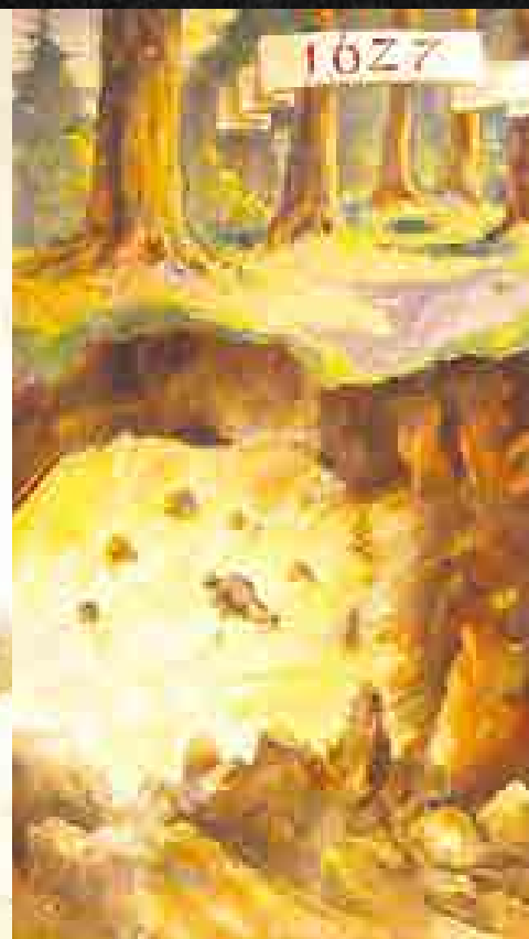
▲ Táróból kezdetleges típusú csillét kitoló bányász. Az egyik legkorábbi csilleábrázolás (Rozsnyó, 1513)