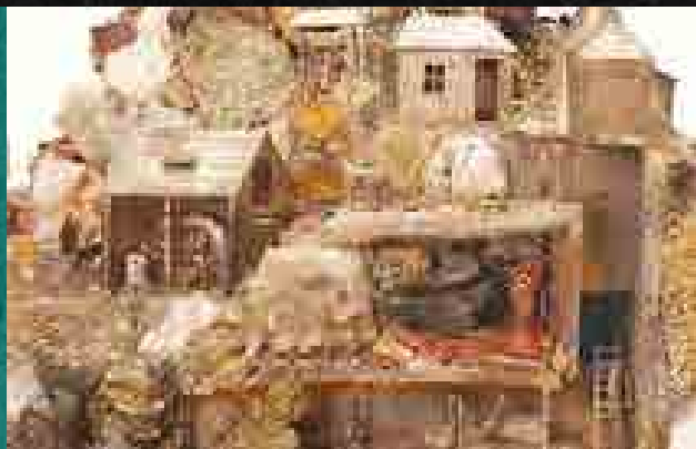
A selmeci bányahegy, makettszerű asztali dísz, részlet (18. század)