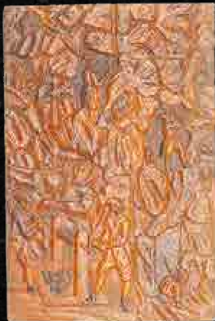
Faragott intarziás fatábla, bányamunka ábrázolásával. Erdélyi Fejedelemség, Zalatna (1610-es évek), Soproni Múzeum Központi Bányászati Múzeum

ták megoldani, s a rézpénzt sem tudták nemesfém pénzre váltani, ezért a szabadságharc bukása közvetett módon a bányák állapotára is visszavezethető. A víztelítést a 18. század közepére az újabb altárók és a bányagépészek gépei oldották meg. A tűzgépek és a selmecbányai Hell József Károly vízoszlopos szivattyúja kiemelkedő szerepet játszott ebben. Így a nemesfémérc telérek újra hozzáférhetővé váltak, és a 18. század a selmecbányai ezüstabányászat második fénykorának tekinthető évi 15–25 ezer kg-os termeléssel.