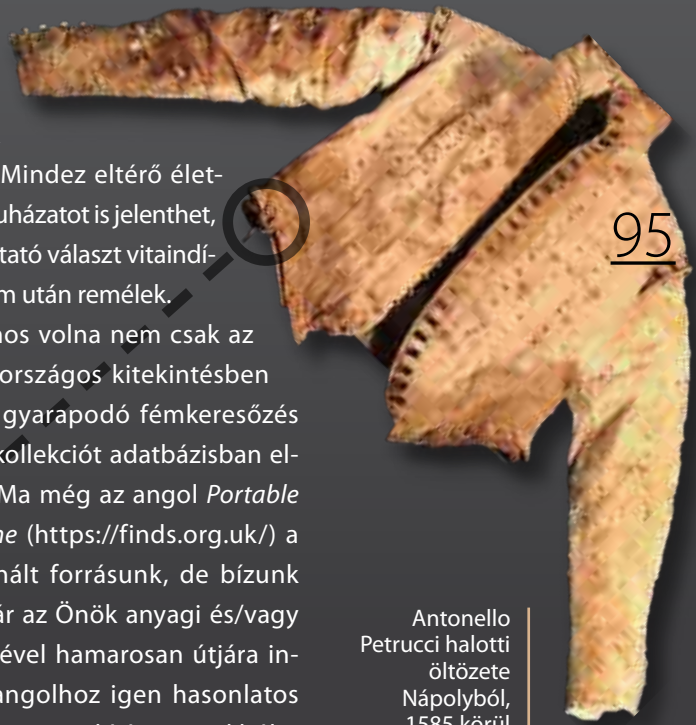
Antonello Petrucci halotti öltözete Nápolyból, 1585 körül

Nagyon hasznos volna nem csak az orosházi, de az országos kitekintésben is napról napra gyarapodó fémkeresőzés során előkerült kollektív adatbázisban elérhetővé tenni. Ma még az angol Portable Antiquities Scheme ( https://finds.org.uk/ ) a leginkább használt forrásunk, de bízunk abban, hogy akár az Önök anyagi és/vagy kétszervi segítségével hamarosan útjára indulhat egy, az angolhoz igen hasonló magyar oldal is. Ez a rövid írás ezen okból is született. Bármilyen ötletet szívesen veszünk: rozo30@hotmail.com