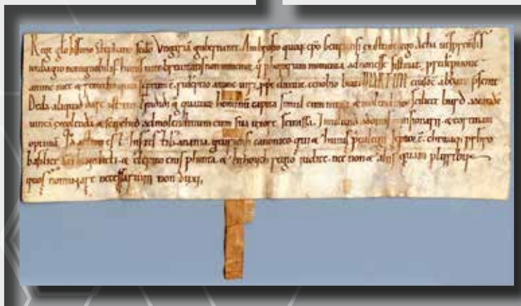
Oklevél a 12. századból

A diplomatikának a 21. század mindennapjaiban is jut élő szerep: a különböző doktori és kitüntető okleveleket, bizonyos egyházi kiadványokat a középkorban rögzült szabályok szerint, latin nyelven is megfogalmazzák.