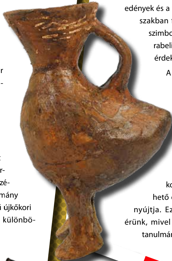
Madár alakú korsó a bronzkorból

A római korról két tanulmány foglalkozik. Egy Baranya megyei villagazdaságról és egy, az alföldi szarmaták temetkezési szokásairól értekező. Az előbbi komplex kutatása (légi felvétel, terepbejárás, fémkeresőzés, próbafeltárás stb.) a nyomozás példás folyamatába enged betekinteni. A másik az 1899 késő őszén, a Hild Viktor vezette jászalsószentgyörgyi szarmata kori halmoknak a szatirikus elemektől sem mentes és kis híján botrányba fulladt ásatásának történetét mutatja be. Elolvasását a szakmabelieknek okulásképpen is, a laikusoknak pedig nem mellékesen szórakozásképpen is aján-