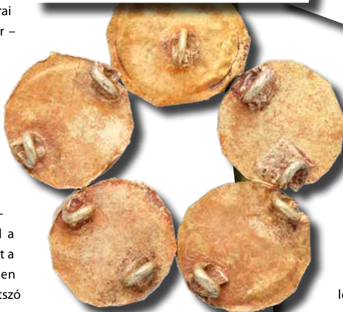
Üvegbetétes aranykorongok Jászsalsószentgyörgyről