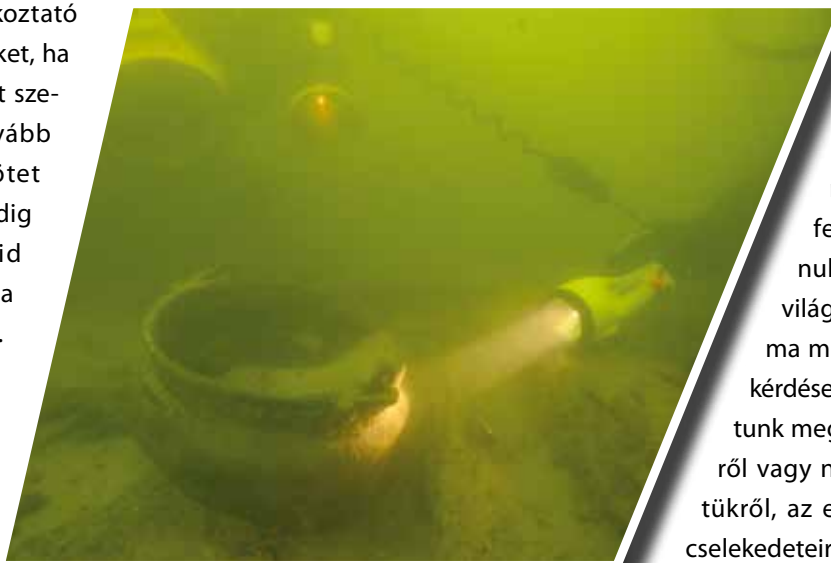
Török kori fémbogrács filmzése a víz alatt