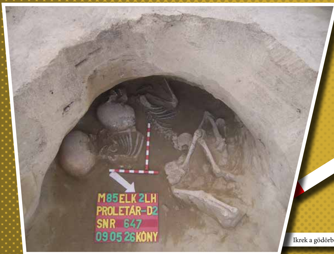
Ikrek a gödörben