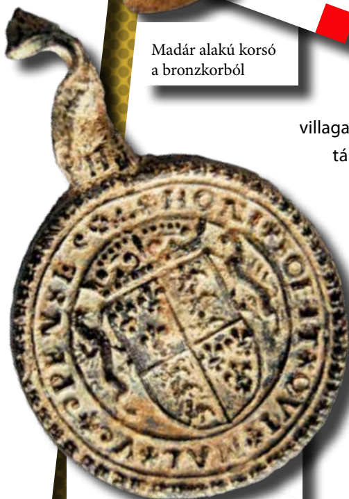
Angol plomba a pápai piactérről