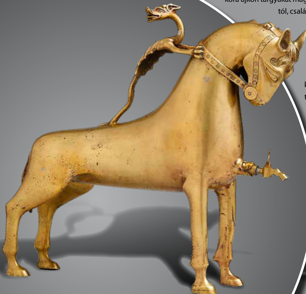
Ló alakú aquamanile