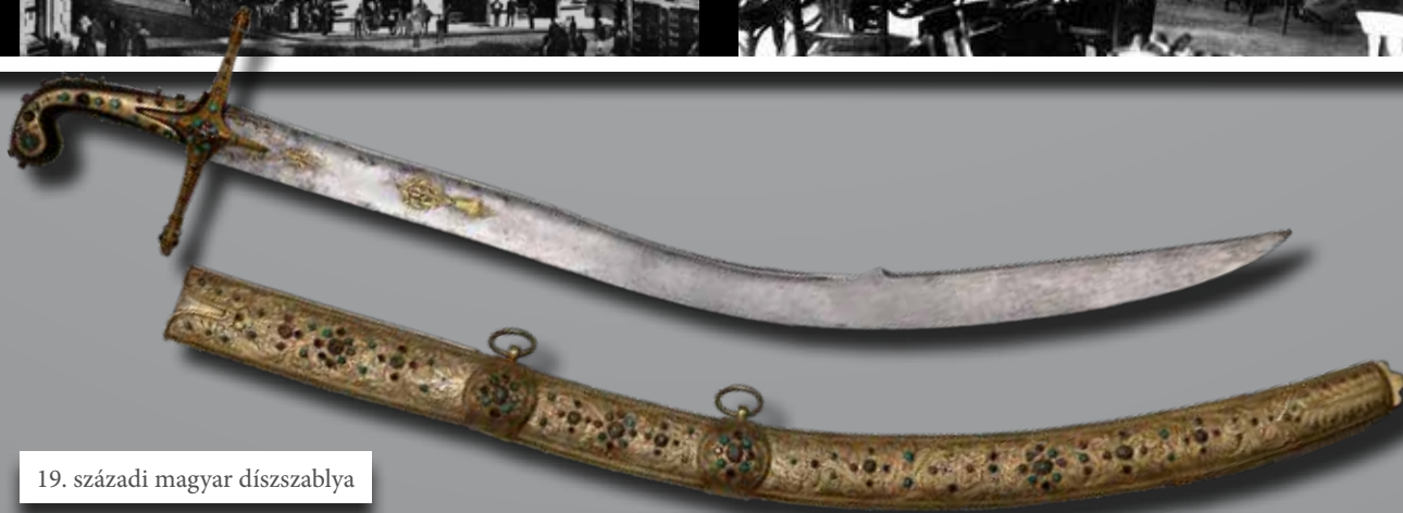
19. századi magyar díszszablya