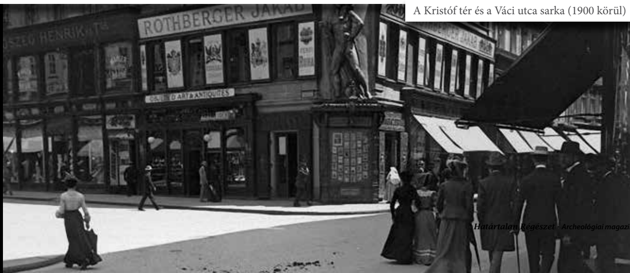
A Kristóf tér és a Váci utca sarka (1900 körül)

Nem kevésszer olvasunk olyan tudósításokat 19. századi, illetve 20. század eleji íróktól – többek között olyan kiterjedt munkássággal rendelkező kutatók tollából, mint Ebenhöch Ferenc győri kanonok, Hild Viktor vagy épp Tömörkény István – melyek érzékletesen írják le a véletlenszerűen vagy földmunkák során napvilágot látó különböző régészeti korszakból származó fémleletek gyakorta nem éppen pozitív kimenetelű sorsát. A földművesek által megtalált tárgyak tetemes része rövid úton szatócsok, ékszerészek, fémművesek boltjaiba jutott, ahol azokat nem ritkán mára már szinte riasztó kíméletlenséggel hasznosították újra. A 19–20. század fordulójának Magyar Nemzeti Múzeuma számos régiségkereskedelemben érdekelt személlyel állt közeli kapcsolatban, ezek sorából kívánunk kiemelni most egy nem mindennapi életpályát, Wiesinger Mór életét.