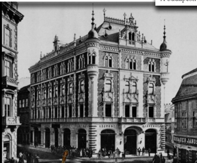
A budapesti Central kávéház