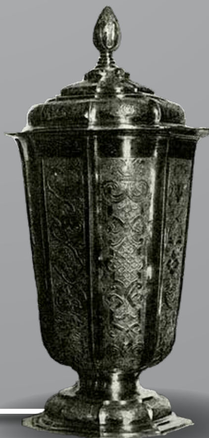
Gróf Bethlen Klára fedeles pohara

származó leletek magasabb aránya (nem érdektelen kiemelni ezek sorából például az állítólag Nagyvárad környéki, dáklakosság jellegű ezüstasztragalosz fibulapárt).