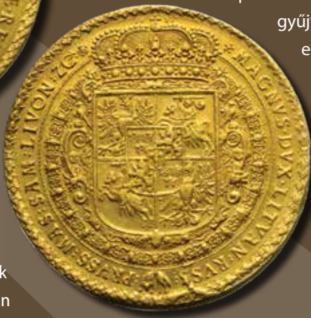
III. Zsigmond lengyel király 1621-ben vert száz dukát súlyú aranyérméje a Magyar Nemzeti Múzeum gyűjteményéből. Hasonló darab kelt el egy New York-i árverésen 2018 januárjában 2,1 millió dollárért