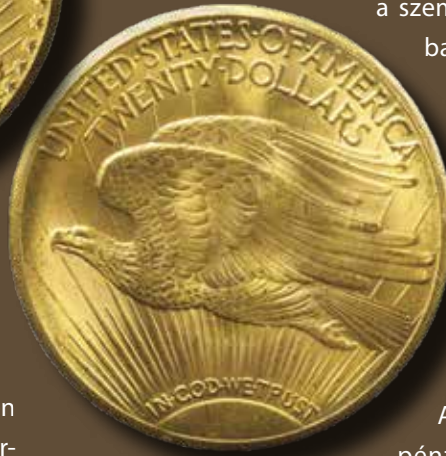
Az utolsó 20 dollár címletű aranypénz (Double Eagle) 1933-ból. A Farouk egyiptomi király gyűjteményét is megjárt darabot 2002-ben 7,6 millió dollárért adták el