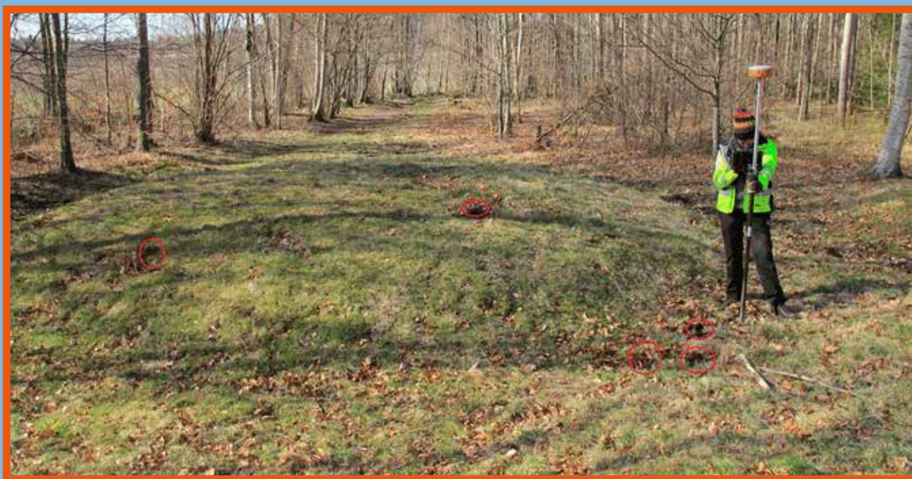
Illegális fémkeresősök által okozott károk felmérése egy viking kori lelőhelyen (a piros karikák a beásott lyukak helyét jelzik)