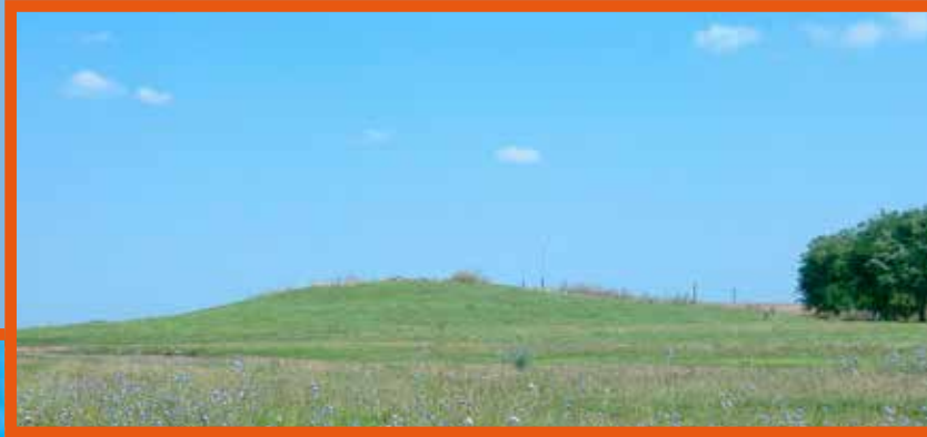
Szállkahalom, védett régészeti lelőhely a Hortobágyi Nemzeti Parkban

Így azonban nem várható el, hogy a lelőhelyeket folyamatos megfigyelés alatt tartsák, az illegális fémkeresőzőket és ásatókat távol tartsák ezektől a helyektől. A régészeti lelőhelyek védelméhez kapcsolódó információkhoz, illetve a régészeti alapismeretekhez különböző tanfolyamokon