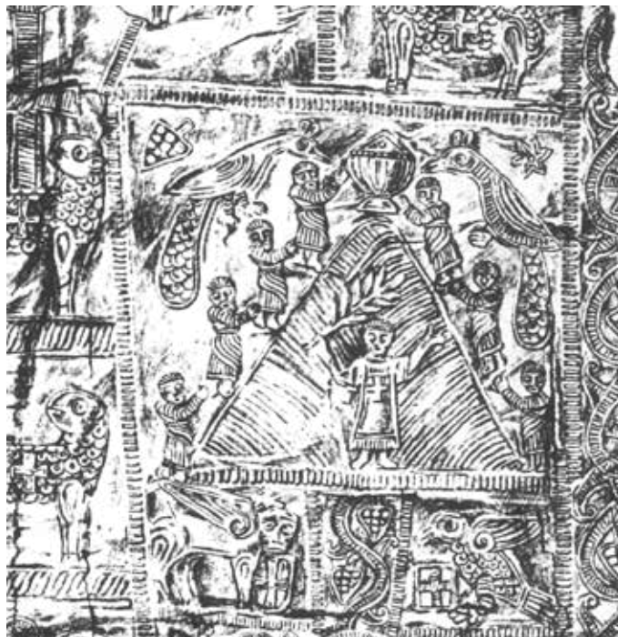
Részletrajzok a „Tesoro sacro” lemezeiről