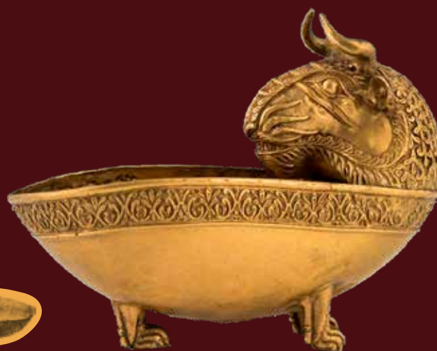
Szarvas-oroszlán alakú edényke a nagyszentmiklósi kincsből (Wien, Kunsthistorisches Museum)