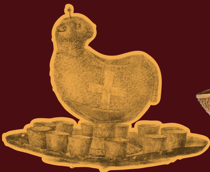
Bárány alakú edényke poharakkal („Tesoro sacro”)

Látva a tárgyak rajzait – fényképeiket nem közölték – a kutatót igencsak meglepi, hogy a különleges lelettel később sem kiállításokon, sem katalógusokban nem találkozik. Ez nem meglepő, mert néhány évvel a tárgyak közzététele után, 1895-ben Hartmann Grisar S. J., az innsbrucki egyetem ókeresztény régészettel foglalkozó jeles tanárának tollából tanulmány jelent meg, amelyben a szerző kimutatta, hogy a „lelet” valójában hamisítvány. Grisar a tárgyakon látható képekről bebizonyította: noha keresztény szimbólumokat használnak, az összeállítások zavarosak, s így ebben az összefüggésben nem lehetnek hitelesek. A képek szokatlanok, furcsák: egy hal hátán hajó áll, amelynek a mélybe merülő horgonylán-