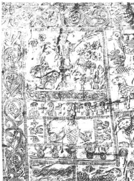
Részletrajzok a „Tesoro sacro” lemezeiről