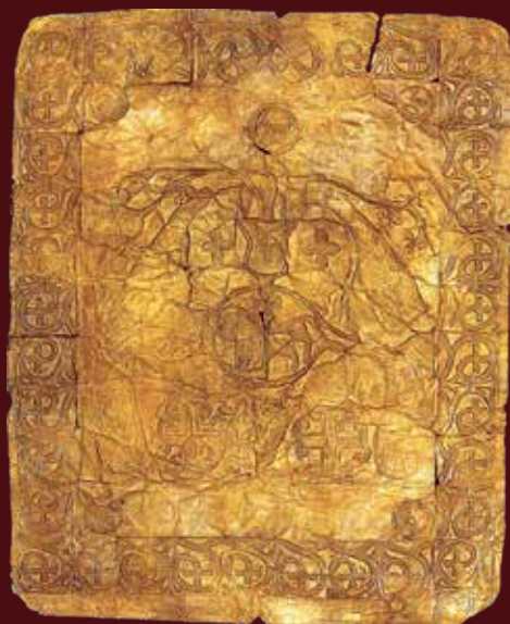
Aranylemez a Magyar Nemzeti Múzeumban