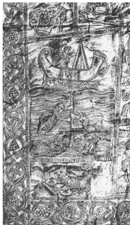
Részletrajzok a „Tesoro sacro” lemezeiről

A mikor a késő római kultúrával és ókeresztény régészettel foglalkozó kutató a Römische Quartalschrift folyóiratot át nézi, akkor az első évfolyamokban (1887, 1888) különleges tárgyak rajzait csodálhatja meg. Anton de Waal (1837–1917), az ókeresztény korról foglalkozó kitűnő szakember három cikkéhez mellélt képtáblákon az első pillanatra „jól keltezhető” kora középkori tárgyak rajzait látja. Ezek ezüst- és aranylemezből készült liturgikus felszerelések, keresztek, könyvtáblák, püspöki viseleti tárgyak, amelyeket keresztény jelképek, szimbólumok díszítenek. Csupa olyan ábrázolás, amik a 4. századtól kezdve gyakoriak az emlékeken: bárányok, halak, madarak, pávák, hajók, horgonyok, keresztek, pálmák. Mindezeket olyan stílusban és olyan ornamentikával ábrázolták, amelyek a 7–8. századi észak-itáliai művészeti emlékekről ismertek. Többségük lemez, de egy edénykészlet is van köztük: a bárányformájú edénykét 12 virágcserep alakú pohár veszi körbe. A tárgyak nyilvánvalóan Krisztust és az apostolokat szándékoztak jelképezni.